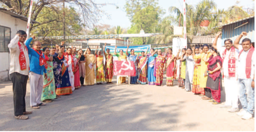
సీ ఐ టీ యు ఆధ్వర్యంలో...