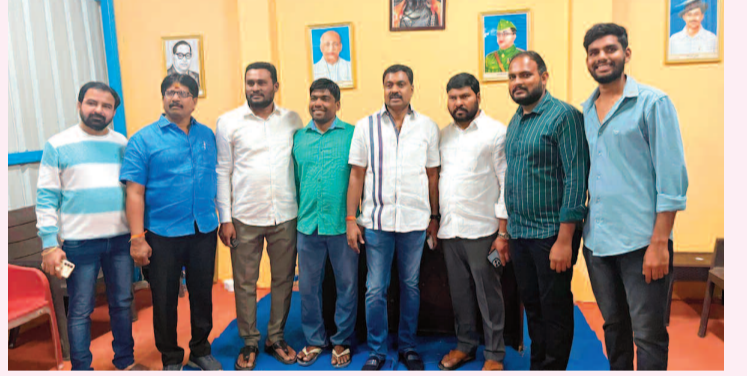
బుద్వేల్ న్యూ గ్రీన్ సీటీ సంక్షేమ సంఘం పాలక వర్గ సభ్యులు