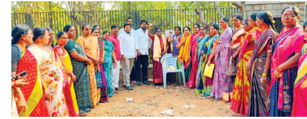
మహిళా దినోత్సవం సందర్భంగా కేక్ కట్ చేస్తున్న మహిళా కాంగ్రెస్ ప్రతినిధులు