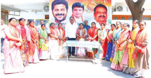
తన నివాసంలో నిర్వహించిన మహిళా దినోత్సవ వేడుకల్లో ఎమ్మెల్యే డి. ప్రకాష్ గౌడ్

ఎమ్మెల్యే డి. ప్రకాష్ గౌడ్ రాజేంద్రనగర్ సర్కిల్లో