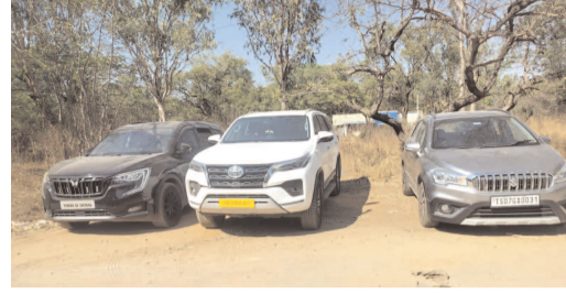
స్వాధీనం చేసుకున్న కార్లు