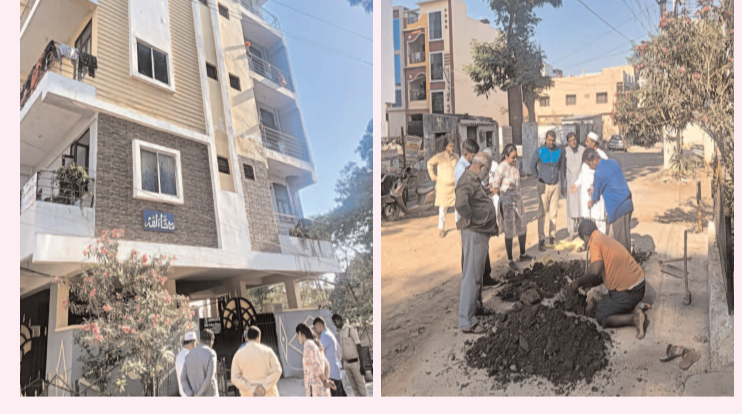
అక్రమ నీటి కనెక్షన్ తొలగిస్తున్న జలమండలి అధికారులు