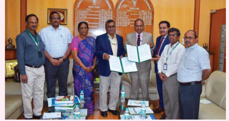
అవగాహన ఒప్పందం పత్రాలను మార్చుకుంటున్న అధికారులు