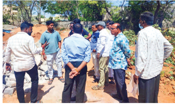
పార్కు స్థలం చుట్టూ ఫెన్సింగ్ చేయవల్సివచ్చిన పాస్ ఎం డీ ఏ సిబ్బంది