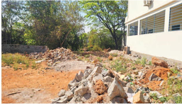
మధుబన్ కాలనీ లోని పార్కు స్థలం