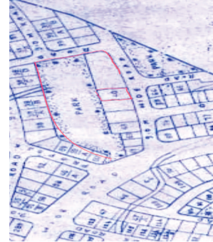
మధుబన్ కాలనీలో గల పార్కు స్థలంకు సంబంధించిన లో అప్డేట్ మ్యాప్