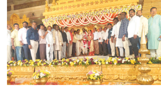
ఫణి విజ్ఞాన్-స్నేహికలను ఆశీర్వాదిస్తున్న గుర్తింపు పొందిన ప్రయివేటు పాఠశాలల యాజమాన్య సంఘం నాయకులు, శ్రేయోభిలాషులు