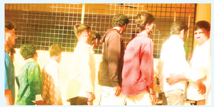
పరీక్షా కేంద్రం వద్ద విద్యార్థులు

రాజేంద్రనగర్ ప్రభుత్వ జూనియర్ కళాశాలలో... రాజేంద్రనగర్ ప్రభుత్వ జూనియర్ కళాశాలలో 360 మంది విద్యార్థులు ఇంటర్ ద్వితీయ సంవత్సరం మొదటి పేపర్ పరీక్షా రాయాల్సి ఉండగా 13 మంది విద్యార్థులు గైరాహజరు అయ్యారు. 347 మంది విద్యార్థులు పరీక్షలు రాశారు. ఇంటర్ పరీక్షలు రాజేంద్రనగర్ మండలలో ప్రశాం తంగా జరిగాయి.