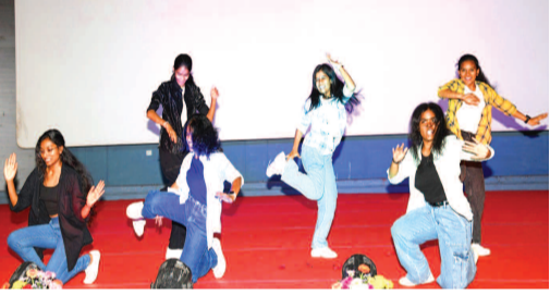
కాలేజీ దే లో పాల్గొన్న బిగ్ బాస్ ఫేమ్ అవినాష్.. సాంస్కృతిక కార్యక్రమాలు నిర్వహిస్తున్న విద్యార్థులు