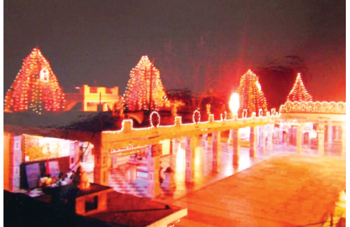
నేతాజీ నగర్ పాఠశాలలో నిర్వహించిన పోటీలలో పాల్గొన్న చిన్నారు.. రాజేంద్రనగర్ లోని హరి హర క్షేత్రం