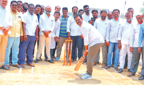
బ్యాట్ పట్టి క్రీడలు ప్రారంభిస్తున్న ఎమ్మెల్యే జిఎం ఆర్