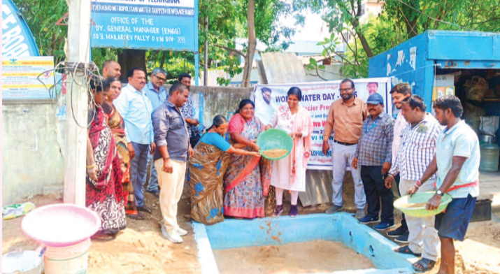
మైలార్ దేవుపల్లి జలమండలి సెక్టర్ ఆఫీస్ వద్ద ఇంకుడు గుంతను పునరుద్ధరిస్తున్న అధికారులు