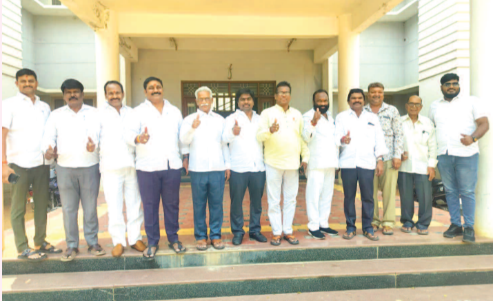
పూలే జయంతి ఉత్సవాల కమిటీ నాయకులు