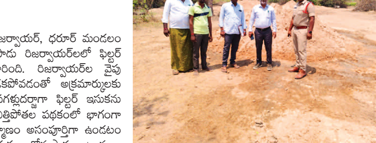
చిన్నోనపల్లి రిజర్వాయర్లో ఇసుక దంపనను స్వాధీనం చేసుకున్న పోలీస్ రిజర్వాయర్ల శాఖ అధికారులు

గద్వాల ప్రతినిధి, మార్చి 27 (ప్రభాత ఉదయం) జిల్లాలో ఎక్కడపడితే అక్కడ మట్టి పర్చిషన్ లేకుండా మట్టిని తోచి కచ్చులుగా పోసి, తడిగా ఉన్న మట్టిని బాగా ఎండబెట్టి వీటి నుంచి మోటార్ ద్వారా ఫిల్టర్ చేసి, వాటి నుంచి ఇసుకను వేరు చేస్తున్నారని ప్రజలు ఆరోపిస్తున్నారు. ప్రభుత్వ ఖజానాకు గండి కొట్టడమే కాకుండా, అమాదుక ప్రజలను మోసగిస్తూ నాణ్యతలేని ఇసుక వ్యాపారం చేస్తున్నారని ఆరోపణలున్నాయి. ప్రభుత్వం రెవెన్యూ అంధత్వం 24 గంటల కఠింబ ఫిల్టర్ ఇసుక వ్యాపారాలకు గొప్ప వరంగా మారిందని చెప్పుకోవచ్చు. పంటలు పండించుకోవడానికి రైతులకు ప్రభుత్వం అందజేస్తున్న ఉచిత విద్యుత్తు కొంతమంది వ్యాపారులకు వరంగా మారింది. ఫిల్టర్ ఇసుక మాఫియా గ్యాంగ్ ఇసుకను ఫిల్టర్ చేయడానికి ప్రభుత్వం వ్యవసాయానికి ఉచితంగా సరఫరా చేసే కఠింబులను వినియోగించుకొని, బోరు ద్వారా మోటార్ తో మట్టి నుంచి ఇసుకను తీసి ఒక దగ్గర స్టోరేజ్ చేస్తున్నారని ప్రజలు చర్చించుకుంటున్నారు. కఠింబు మీటర్లు లేకుండా ఎలక్ట్రికల్ వారి పర్చిషన్ లేకుండా అక్రమంగా 24 గంటల కఠింబు వారుతున్నారని ఆరోపణలు వినిపిస్తున్నాయి. ప్రభుత్వాన్ని కళ్ళు గప్పి, ప్రభుత్వ లక్ష్యానికి తూట్లు పొరుస్తూ ఉచిత విద్యుత్తును అక్రమ మార్గంలో వాడుకుంటూ దండాలో లక్షలు గడిస్తున్నారు.