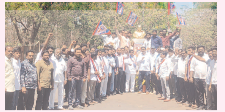
విశ్వవిద్యాలయంలో రా్యాలి నిర్వహిస్తున్న టీసీ ఉద్యోగులు, విద్యార్థులు