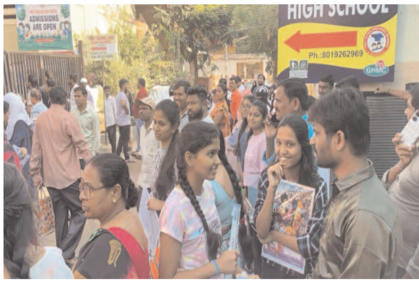
హైదర్ గూడ టైన్ స్కూల్ హై స్కూల్ వద్ద పరీక్షలు రాయడానికి వచ్చిన విద్యార్థులు