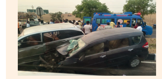
పెట్టెర్ బైపాస్ లో ఘోర రోడ్డు ప్రమాదం