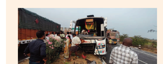
పెట్టెర్ బైపాస్ లో ఘోర రోడ్డు ప్రమాదం

కేటీడోడ్డి మండలం వెంకటాపురం గ్రామంలో వెలసిన పాగుంటా శ్రీలక్ష్మీ వెంకటేశ్వర స్వామి వారి కళ్యాణ మహోత్సవం కన్నుల పండువగా కొనసాగింది. శుక్రవారం