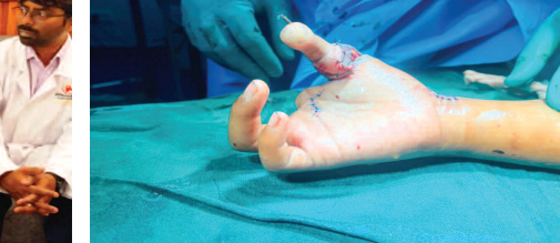
కాలు వ్రేలు తీసి కుడి చేతి బ్రౌటన వ్రేలు వేసిన డాక్టర్లు