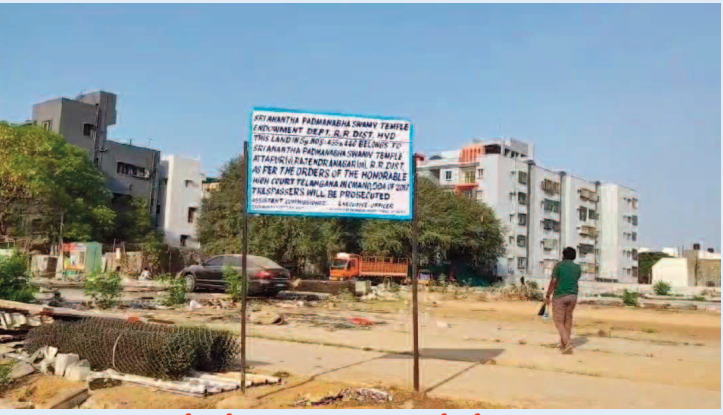
హైదర్ గూడలోని దేవదాయ శాఖ భూముల్లో బోర్డు పాతిన అధికారులు