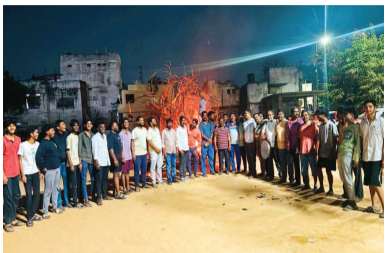
రాజేంద్రనగర్ సర్కిల్లో యూత్ క్లబ్ ఆవరణలో జరిగిన కామదహనం కార్యక్రమంలో పాల్గొన్న యువకులు