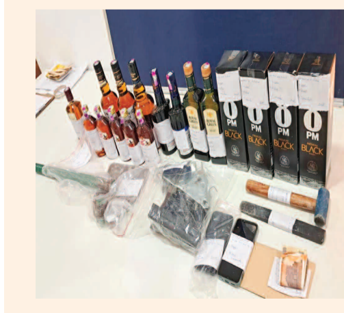
స్వాధీనం చేసుకున్న మధ్యం బాటిళ్లు