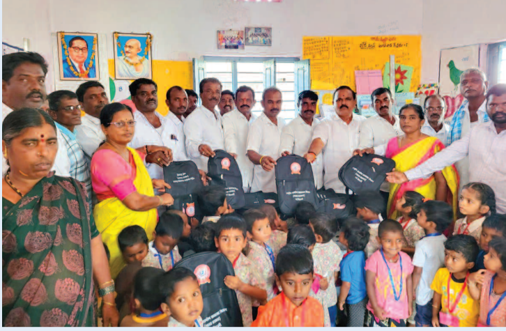
విద్యార్థులకు బ్యాగులు అందజేస్తున్న నాయకులు