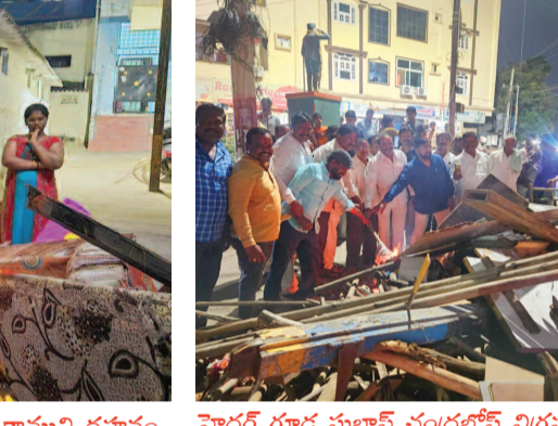
హైదర్ గూడ సుభాష్ చంద్రబోస్ చిగ్రహం వద్ద కామ దహనం చేస్తున్న బస్సె వెద్దలలు