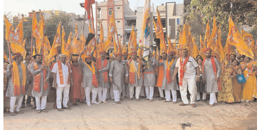
శోభా యాత్రలో పాల్గొన్న భక్తులు

బుద్వేల్, మార్చి 10 (ప్రభాత ఉదయం): అత్తాపూర్ లో సోపానం శ్రీ శ్యామ్ మిత్ర మండలి అధ్యక్షులతో శ్రీ శ్యామ్ బాబా నిషాన్ యాత్ర ఘనంగా జరిగింది. 14న పవర్సాలగా