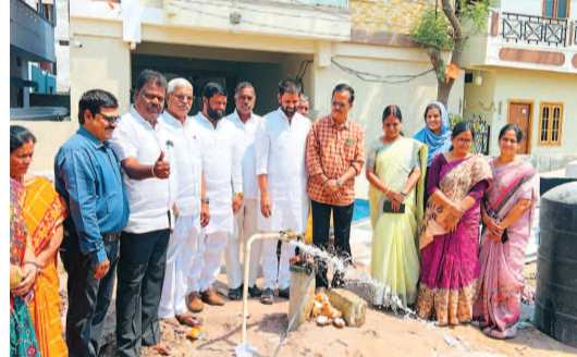
బోరు మోటారును ప్రారంభిస్తున్న దాతలు, ఉపాధ్యాయులు, విద్యా శాఖ అధికారులు