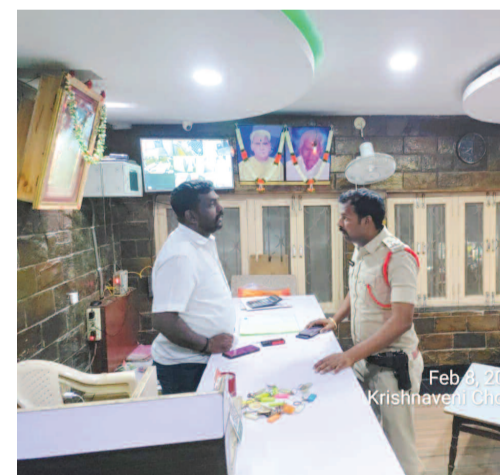
లాడ్జీలో లో విచారణ అడిగి తెలుసుకుంటున్న పోలీసులు..