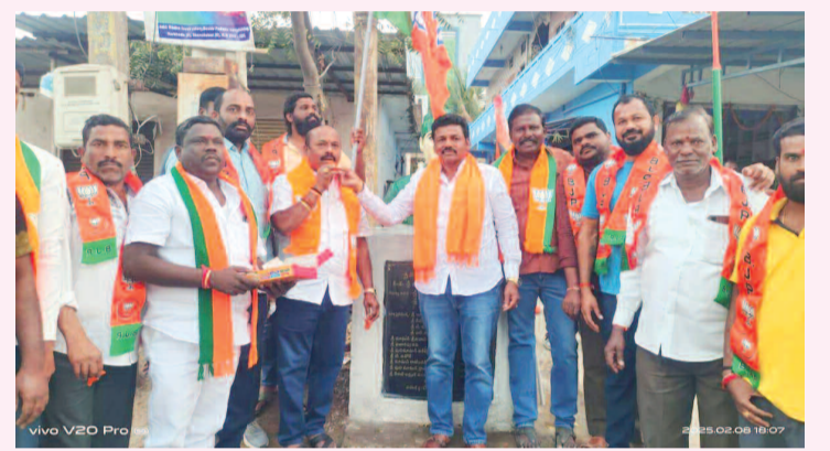
ఢిల్లీలో ఘన విజయం సాధించిన సందర్భంగా మిఠాయిలు పంచి పెట్టుకుంటున్న బీజేపీ నాయకులు