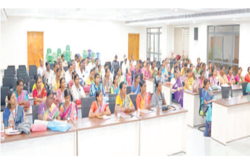
సమావేశంలో మాట్లాడుతున్న అదనపు కలెక్టర్ లక్ష్మీ నారాయణ

జిల్లా అదనపు కలెక్టర్ (రెవెన్యూ) లక్ష్మీ నారాయణ