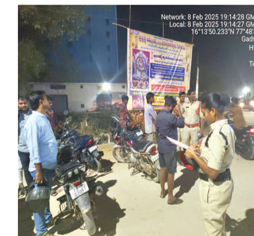
డ్రంక్ అండ్ డ్రైవ్ తనిఖీల్లో పోలీసులు