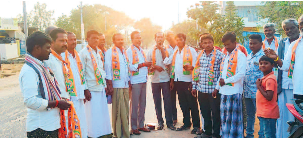
కేటి డొడ్డిలో స్వీట్లు పంచుకుంటున్న బిజెపి నాయకులు