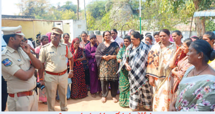
హిజ్రాలు సూచనలు చేస్తున్న పోలీసులు