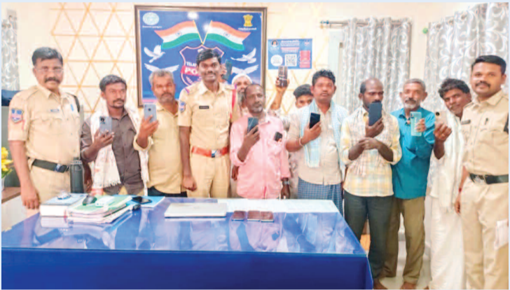
దొంగతనంలో స్వాధీనం చేసుకున్న సెల్ ఫోన్లను ఫిర్యాదుదారులకు అందజేస్తున్న పోలీసులు