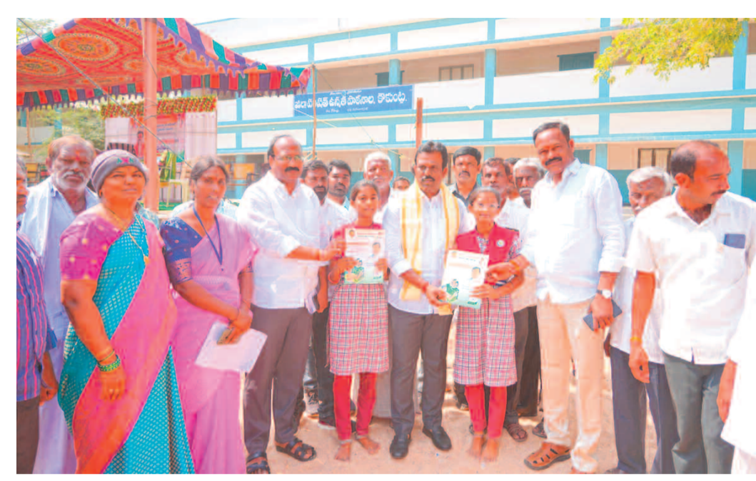
విద్యార్థులకు స్టడీ మెటీరియల్ అందజేస్తున్న ఎమ్మెల్యే జిఎంఆర్