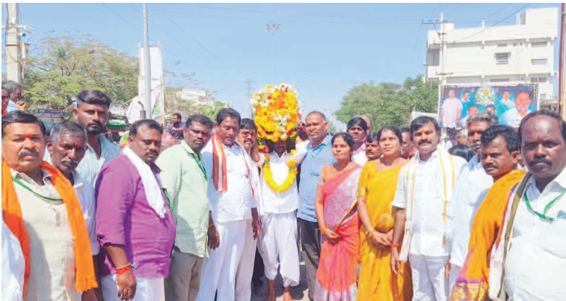
అమ్మవారిని ఊరేగింపుగా తీసుకు వస్తున్న ఆలయ కమిటీ చూపే పురేందర్, కమిటీ ప్రతినిధులు..