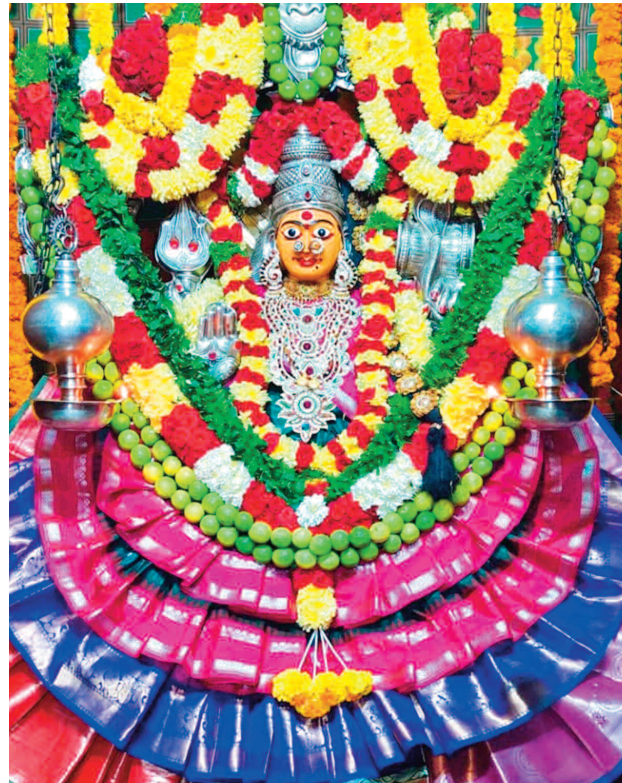
కొలుపు దిగుతున్న జమ్మలమ్మ అమ్మవారు

జమ్మలమ్మకు పోటెత్తిన భక్తులు గద్వాల పట్టణ పరిధిలోని శ్రీజమ్మలమ్మ అమ్మవారిని దర్శించుకోవడానికి మంగళవారం భక్తులు పోటెత్తారు. గద్వాలయంలో ప్రత్యేక అలంకరణలో ఉన్న అమ్మవారిని దర్శించుకొని భక్తులు పరవశించారు. బైస్కో, కర్నూల్ డోలు చమ్మిళ్లు, శివసత్తుల పూసల నడుమ, జమ్మలమ్మ కనబడిన పన్ను అంబల భక్తులు అమ్మవారిని కొలిచారు. జమ్మలమ్మ బ్రహ్మోత్సవాలు ప్రారంభమైన నేపథ్యంలో తెలంగాణ రాష్ట్రంలో పాటు కర్పాటక, మహారాష్ట్ర తదితర ప్రాంతాల నుంచి వచ్చిన భక్తులతో ఆలయ క్షేత్రం కిక్కిరిసింది. వేలాది మంది భక్తులు తరలివచ్చడంతో పరసం ప్రాంతాల రద్దీగా మారాయి. ఆలయ గదులతో పాటు పరిసరాలలో పాములను వేసకొని నైవేద్యాన్ని సిద్ధం చేసుకొని అమ్మవారికి సమర్పించారు. చిర, రవికతో పాటు వెంకట పాలా, కడియాలు, బియ్యాన్ని అమ్మవారికి అర్పించి, మొక్కులు తీర్చుకున్నారు.