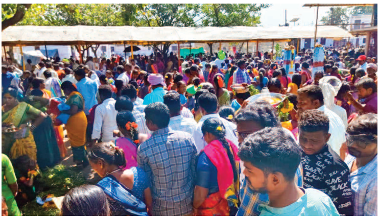
అమ్మవారిని దర్శించుకోవటానికి తరలివచ్చిన భక్తులు