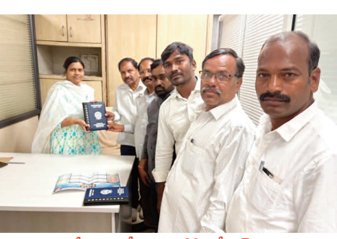
పి.ఓ. కు డైరీ అందజేస్తున్న అసోసియేషన్ ప్రతినిధులు