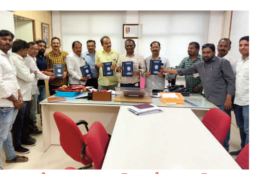
డైరీ ఆవిష్కరణకు ఎస్ ఈ శ్రీరామ్మోహన్