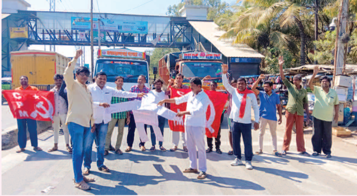
కాబ్‌దాన్ గజేక్ నగర్ చౌరస్తాలో కేంద్ర బడ్జెట్ ప్రతులను తగుల బెట్టిన సీపీఎం నాయకులు