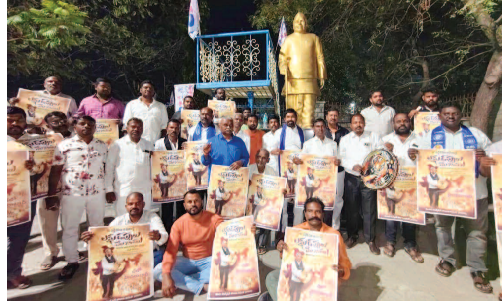
వార్ వోస్టర్ ను అవిష్కరిస్తున్న మాదిగ నాయకులు

రాజేంద్రనగర్, ఫిబ్రవరి 3 (ప్రభాత ఉదయం): విద్యుత్ వినియోగదారులు తమ ప్రాంతాలలో ఉన్న విద్యుత్ సమస్యలను తమ దృష్టికి తీసుకురావాలని వాటిని క్షేత్ర స్థాయిలోనే పరిశీలించి పరిష్కరిస్తామని రాజేంద్రనగర్ విద్యుత్ డివిజన్ ఇంజనీర్ పి.రత్నాకర్ రావు అన్నారు. సోమవారం శివరాంపల్లిలోని విద్యుత్ కార్యాలయంలో ఆయన మాట్లాడుతూ, ప్రభుత్వం వేసేవి కాలంలో విద్యుత్ సమస్యలను ఎదుర్కొనేకుండా నిరంతర విద్యుత్ అందించేందుకు ప్రత్యేక ప్రణాళికలు రూపొందించే ద్వారా, ఉప ముఖ్యమంత్రి, విద్యుత్ శాఖ మంత్రి భట్టి విక్రమారావు అదేశాల మేరకు వేసేవిలో వినియోగదారులు ఇబ్బందులు గురికాకుండా ప్రత్యేక పర్యవేక్షణ చేపడుతున్నట్లు ఆయన తెలిపారు. అధికారులు ఇప్పటికే క్షేత్రస్థాయిలో ఉన్న సమస్యలను పరిశీలించి అంచనాలు రూపొందిస్తున్నారని వాటిని సత్వరమే పరిష్కరించేందుకు తగిన చర్యలు తీసుకుంటామన్నారు.