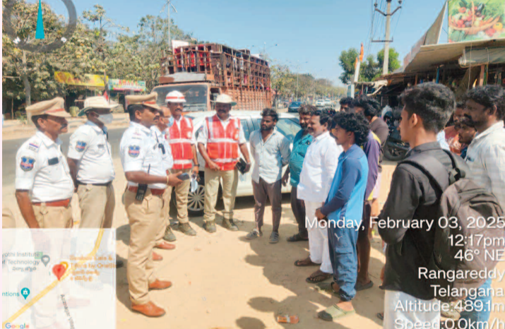
వాహన దారులకు అవగాహన కల్పిస్తున్న ట్రాఫిక్ పోలీసులు