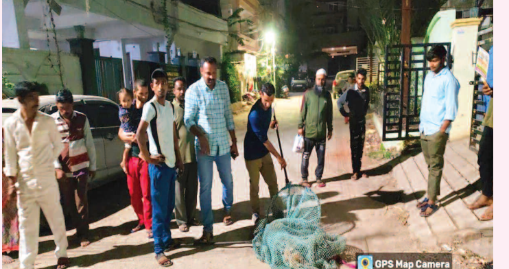
వీధి కుక్కలను పట్టుకెళ్ళిన జీహెచ్ఎస్ వెటర్నరీ విభాగం సిబ్బంది

రాజేంద్రనగర్, ఫిబ్రవరి 1 (ప్రభాత ఉదయం): కాటేడాన్ సబ్ స్టేషన్ -1 ఫీడర్ -3 పరిధిలో కరెంట్ మరమ్మత్తుల కారణంగా ఈ నెల 2వ తేదీన ఉదయం 10 గంటల నుంచి మధ్యాహ్నం ఒంటిగంట వరకు కరెంటు సరఫరాలో అంతరాయం ఉంటుందని సంబంధిత విద్యుత్ శాఖ అధికారులు ఓ ప్రకటనలో తెలిపారు. ఫుడ్స్ ఫుడ్స్ చింటా ఫుడ్స్, సాగర్ గుట్టా, చాపుల ఫుడ్స్, భగవతి దాల్ చిల్, ఏఎస్ ప్లాస్టిక్, కాటేడాన్ ఇండస్ట్రీయల్ ఏరియాలో పాటు సిటిజన్ కాంట్, వికాస్ ఫుడ్స్, డ్యూక్స్, ఏఎంఎల్ ఫర్నిచర్, విఎల్ ఫర్నిచర్, చాతయే కంపెనీ, లతో పాటు గణేష్ నగర్, అమ్మ గార్డెన్, చయనీర్ స్కూల్, బాబా టెంట్ హౌస్, షూ టెంట్ హౌస్ ప్రాంతాలలో కరెంటు ఉండదన్నారు.