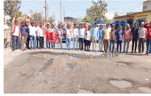
కాటేడాన్- ఓల్డ్ కర్నూల్ రోడ్డు లో పాడైన రోడ్డు పక్క నిరసన తెలుపుతున్న సీపీఎం నాయకులు.. బోల్తా పడిన ఆటో