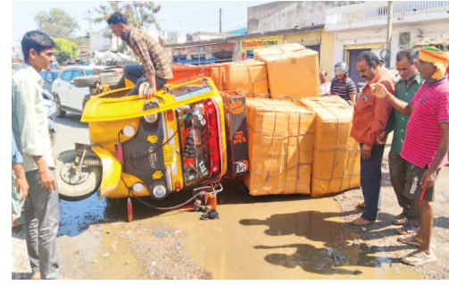
కాటేడాన్- ఓల్డ్ కర్నూల్ రోడ్డు లో పాడైన రోడ్డు పక్క నిరసన తెలుపుతున్న సీపీఎం నాయకులు.. బోల్తా పడిన ఆటో