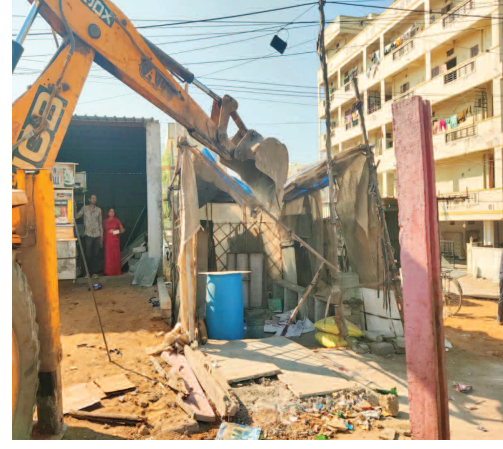
దుర్గా నగర్ నుంచి పల్లె చెరువు వరకు రోడ్డుకు ఇరువైపులా ఉన్న ఫుట్ పాత్ అక్రమణలను తొలగించి రాజేంద్రనగర్ సర్కిల్ టౌన్ ప్లానింగ్ సిబ్బంది

బుద్వేల్, ఫిబ్రవరి 1 (ప్రభాత ఉదయం) : దుర్గానగర్ నుంచి మైలారేవుపల్లి, ఉదంగండ్ల మీదుగా బండ్లగూడ కు వెళ్ళే మార్గంలో రాజేంద్రనగర్ సర్కిల్ పరిధి వరకు రోడ్డు కిరువైపుల ఉన్న 160 ఫుట్ పాత్ అక్రమణలను శనివారం రాజేంద్రనగర్ సర్కిల్ టౌన్ ప్లానింగ్ అధికారులు తొలగించారు. జీహెచ్ఎస్ దక్షిణ మండలం జోనల్ కమిషనర్ డి.వెంకటేశ్వర్లు ఆధ్వర్యంలో దుర్గానగర్ సర్కిల్