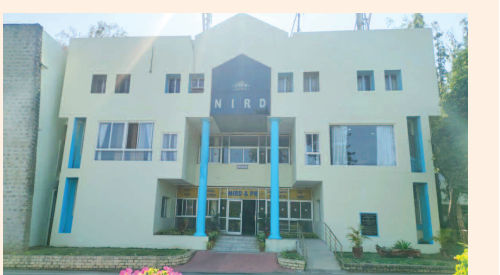
రాజేంద్రనగర్ లోని జాతీయ గ్రామీణాభివృద్ధి పంచాయతీ రాజ్ సంస్థ (ఎన్ఐఆర్ఐ పీఆర్) ప్రధాన కార్యాలయం