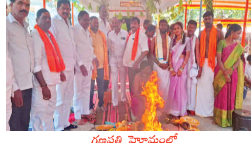
గణపతి హోమంలో పాల్గొన్న ప్రజాపితా భక్త సమాజం సభ్యులు