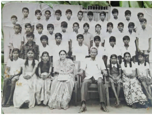
బి సెక్షన్ విద్యార్థులు