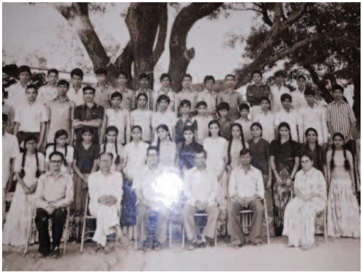
1984-85 బ్యాచ్ 10వ తరగతి ఎ సెక్షన్ విద్యార్థులు ఆనాడు తీసుకున్న ఫోటో