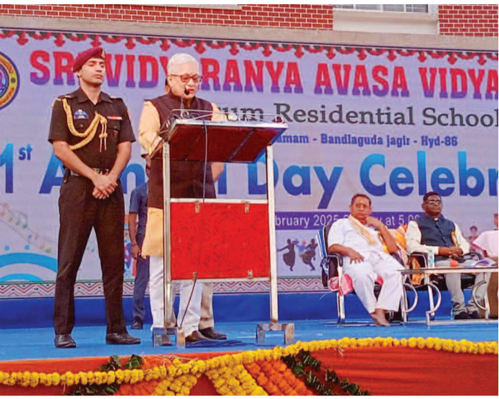
విద్యారణ్య ఆవాస విద్యాలయం వార్షికోత్సవం కార్యక్రమంలో ప్రసంగిస్తున్న గవర్నర్ జిష్ణు దేవ వర్మ