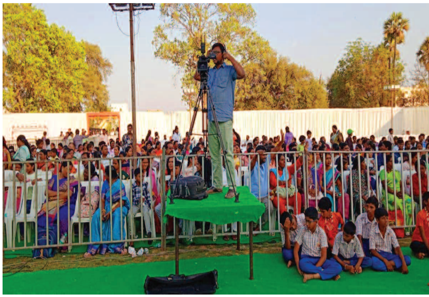
వార్షికోత్సవంలో పాల్గొన్న విద్యార్థుల విద్యార్థులు