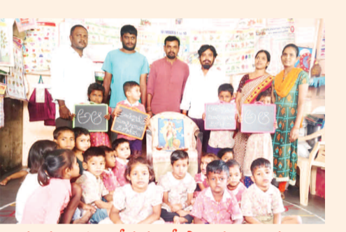
మాతృ భాష దినోత్సవంలో పాల్గొన్న చిన్నారులు