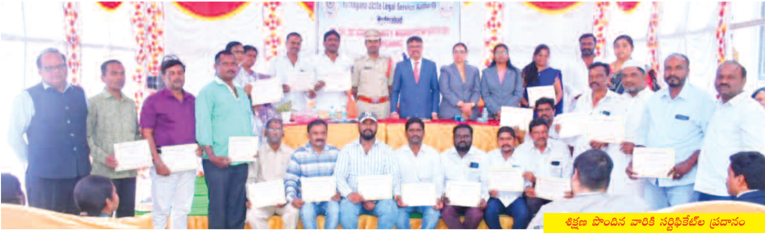
శిక్షణ పొందిన వారికి సర్టిఫికేట్ల ప్రదానం