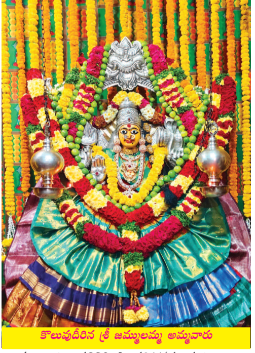
కొలువడిన శ్రీ జమ్మలమ్మ అమ్మవారు