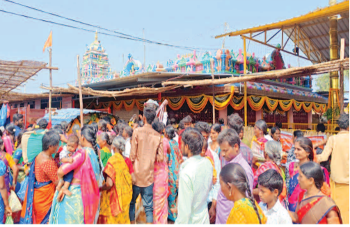
దర్శనం కోసం వేలాదిగా తరలివచ్చిన భక్తులు