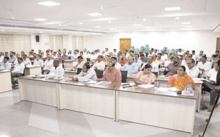
సమావేశంలో పాల్గొన్న అధికారులు