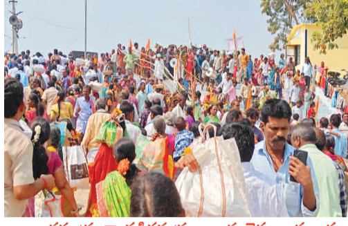
జనసంద్రంగా నడిగడ్డ ప్రజల ఇష్ట వైపం జమ్మలమ్మ జాతర ప్రారంభం

షామియాలను వేసుకొని నైవేద్యాన్ని సిద్ధం చేసుకొని అమ్మవారికి సమర్పించారు. చీర, రవికతో పాటు వెండి పాదాలు, కడియాల, బియ్యంను అమ్మవారికి అర్పించి, మొక్కులు తీర్చుకున్నారు. భక్తులు అమ్మవారిని దర్శించుకునేందుకు ఎలాంటి ఇబ్బందులు కలుగకుండా ప్రత్యేక కూలైన్లను ఏర్పాటు చేశారు. అమ్మవారి సన్నిధిలో కూర్చోవడానికి చలువ పందిర్రను ఏర్పాటు చేశారు. తెల్లవారుజామున నుంచే భక్తులు అమ్మవారిని దర్శించుకున్నారు. ఆలయ అర్చకులు ఉదయం అమ్మవారికి ప్రత్యేక పూజలు నిర్వహించారు. జమ్మలమ్మ ఆలయ పరిసర ప్రాంతాలలో గద్వాల పోలీసులు ట్రాఫిక్ అంతరాయం కలుగకుండా పటిష్టమైన చర్యలు చేపట్టారు.