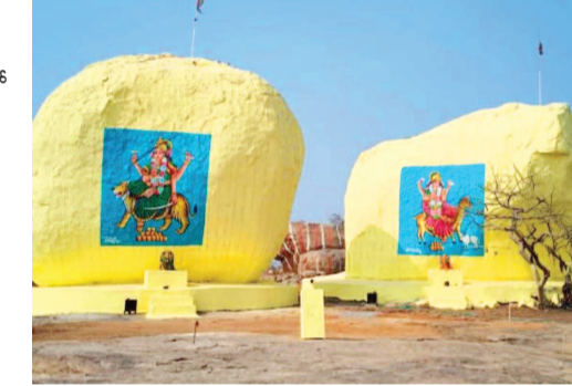
రాజేంద్రనగర్ మానస పాల్వీ సమీపంలోని సమ్మక్క సారలమ్మ దేవాలయం