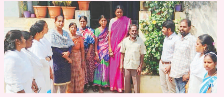
బీసీజీ టీకా పెద్దలకు కూడా వేయాలని అవగాహన కల్పిస్తున్న వైద్య సిబ్బంది

బుద్వేల్, ఫిబ్రవరి 10(ప్రభాత ఉదయం): రాజేంద్రనగర్ సర్కిల్ లోని కొన్ని హెబాటల్ల అపరిశుభ్రమైన వాతావరణంలో కొనసాగుతున్నాయి. సింగ్లీ, జోమాలో లో ఆర్డర్ పెట్టుకోగా అపరిశుభ్రంగా ఆహార వస్తువులు వచ్చాయని ఓ వ్యక్తి ఆన్ లైన్ లో గ్రేటర్ ఫుడ్ సేఫ్టీ అధికారులకు గత వారంలో ఫిర్యాదు చేశారు. దానిపై స్పందించిన గ్రేటర్ ఫుడ్ సేఫ్టీ డివిజన్ బృందంలోని ముగ్గురు అధికారులు జీవవారం అత్తాపూర్ పిల్లర్ నెంబర్ 121 హనుమాన్ దేవాలయం నుంచి బాహుఫూల్స్ వైళ్ల రహదారిలో ఉన్న డి ఫోర్ట్, డెలివ్ మై హెబాట్ కి చెన్ రెస్టారెంట్ లో తనిఖీలు చేశారు. ఈ రెండు హెబాటల్ల అపరిశుభ్రమైన వాతావరణం లో ఉన్నాయని, పెద్ద మొత్తంలో కూరగాయలు ఎక్కువ రోజుల నుంచి నిల్వ ఉంచారని తెలిపారు. నిల్వ ఉంచిన ఫ్రీజ్ కూడా సరిగ్గా లేదన్నారు. బొడ్డింకలు తిరుగుతున్నట్లు కనిపించినందున అధికారులు తెలిపారు. దీనిపై సదరు హెబాటల్ నిర్వాహకులకు నోటీసులు ఇవ్వడం జరిగింది ద్వారా. ఏడు రోజుల లోగా వారు సమాధానం చెప్పవలసి ఉంటుంది, ఆ తర్వాత వాస్తవ చర్యలు తీసుకోవడం జరుగుందని ఫుడ్ సేఫ్టీ డివిజన్ అధికారులు తెలిపారు.