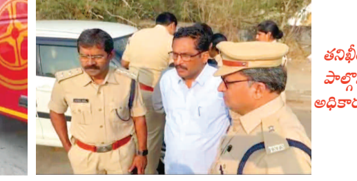
తనిఖీలో పాల్గొన్న అధికారులు