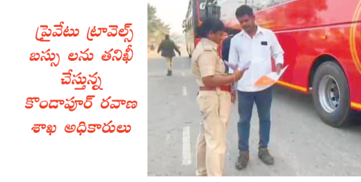
ప్రైవేటు ట్రావెల్స్ బస్సు లను తనిఖీ చేస్తున్న కొండాపూర్ రవాణ శాఖ అధికారులు

ఏర్పాటు చేయాలని తీర్మానించారు. గద్వాల అలంపూర్ నియో జకవర్గాల్లో ఎంపీటీసీ స్థానాలను పెంచాలని తీర్మానించారు. గద్వాల జిల్లాలో అన్ని మున్సిపాలిటీలలో కొన్నింటిని స్థానాలను పెంచాలని తీర్మానించారు. గద్వాల నియోజకవర్గంలో నూతన వంపాయతీలు ఏర్పాటు చేయాలని తీర్మానించారు. కార్యచరణలో భాగంగా ఈనెల 17వ తేదీన అఖిలపక్ష కమిటీ ఆధ్వర్యంలో జిల్లా కలెక్టర్ కు వినతి పత్రం సమర్పించి, తీర్మానాలను ప్రభుత్వం దృష్టికి తీసుకెళ్లి ఏర్పాటు చేయాలిందిగా కోరడం జరుగుతుందన్నారు.