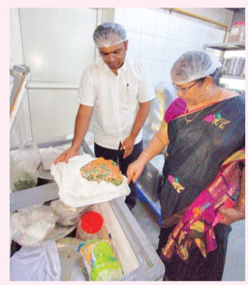
హెబాటల్లో తనిఖీలు చేస్తున్న ఫుడ్ సేఫ్టీ విభాగం టూన్స్ ఫోర్స్ అధికారులు