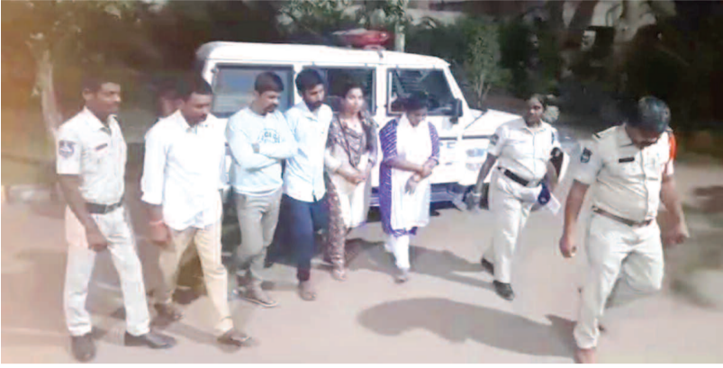
పోలీసుల ఆదుపులో నిందితులు