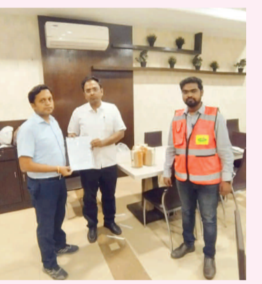
హెబాటల్ నిర్వాహకులకు నోటీసులు ఇస్తున్న అధికారులు