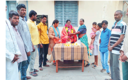
సదాలక్ష్మిని సన్మానిస్తున్న స్థానికులు