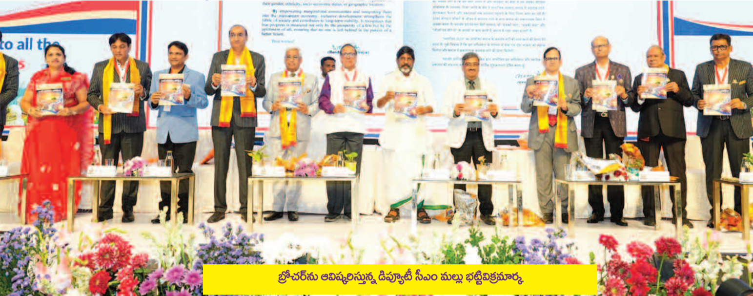
బ్రాచర్లను అవార్డులను దివ్యాదీ సీఎం మల్లు భట్టివిక్రమార్కు

విద్య, వైద్య రంగాల్లో ప్రజా ప్రభుత్వం విశేష కృషి మహావీర అంతర్జాతీయ సదస్సులో డివ్యాదీ సీఎం భట్టి మల్లు విక్రమార్కు