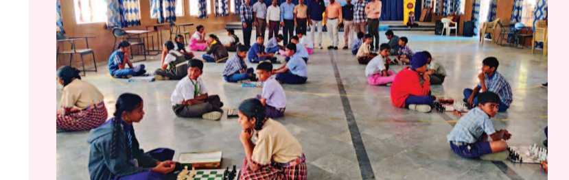
చదరంగం పోటీలలో పాల్గొన్న విద్యార్థులు