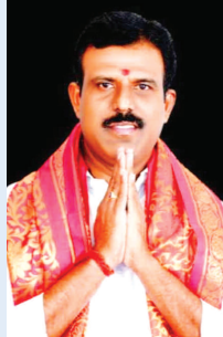
దేవరకర్ల ఎమ్మెల్యే జిఎంఆర్

దేవరకర్ల, జనవరి 1 (ప్రభాత ఉదయం) అందరికీ మంచి జరగాలని కోరుకుంటూ, మన కుటుంబం మన శ్రేయాభిలాషులు ఎల్లప్పుడు ఆరోగ్యంగా ఉంటాలన్నారు. సంవత్సరాలు వస్తూ ఉంటాయి పోతూ ఉంటాయి కానీ ప్రతి కొత్త సంవత్సరం ఎన్నో ఆశలను మరెన్నో ఆశయాలు మోసుకొస్తాయి. మనం ఇప్పటివరకు చేయలేనిది ఈ కొత్త ఏడాదిలో ఆయన పూర్తి చేయాలని గుర్తించాము. కాలం ఆయన గడిచిన క్షణం వెనక్కి రారు. కాలం ఎలా అయితే ముందుకు వెళ్తుందో, అలాగే మనమంతా కూడా ముందుకు వెళ్ళాలి. పురోగమించాలి. అనుకున్న పనులు నెరవేరాలి అన్న శుభాలు జరగాలని ఆశించాం, భవిష్యత్తు బాగుండాలని కలలు కంటాం, ఆ కలలు నెరవేర్చుకునే దిశగా అడుగులు వేద్దాం. ఈ కొత్త సంవత్సరం ప్రతి ఒక్కరికీ మంచి జరగాలని ఆశిస్తూ, భగవంతుడు ప్రతి ఒక్కరి బీజీవితంలో ఆనందం, విజయం, ఆరోగ్యం ప్రసాదించాలని కోరుకున్నాను.