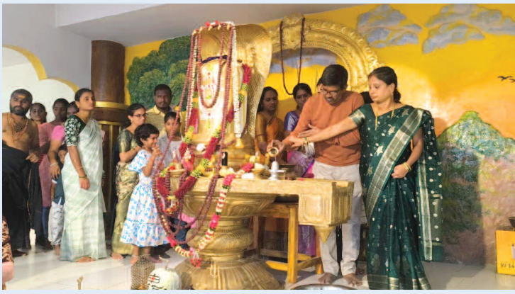
శివుడికి అభిషేకం చేస్తున్న భక్తులు