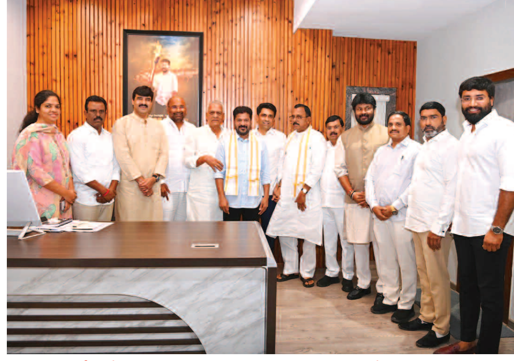
సీఎం రేవంత్ రెడ్డిని సన్మానించిన ఉమ్మడి మహబూబ్ నగర్ జిల్లా ఎమ్మెల్యేలు, నాయకులు

హైదరాబాద్, డిసెంబర్ 31 (ప్రభాత ఉదయం): నూతన సంవత్సరాంధం సందర్భంగా రాష్ట్రంలో జరిగిన మద్యం అమ్మకాలు ప్రభుత్వానికి కిక్కిరించాయి. వందల కోట్లలో మద్యం అమ్మకాలు జోరుగా సాగాయి. డిసెంబర్ నెలకు 926 కోట్ల వరకు నాలుగు రోజుల్లోనే ప్రజలు ఏకంగా రూ. 926 కోట్ల విలువైన మద్యం తాగేశారు. ఈ మేరకు డిసెంబర్ నెల మద్యం అమ్మకాల వివరాలను బుద్వేల్ తెలంగాణ ఎక్సైజ్ శాఖ అధికారులు వెల్లడించారు.