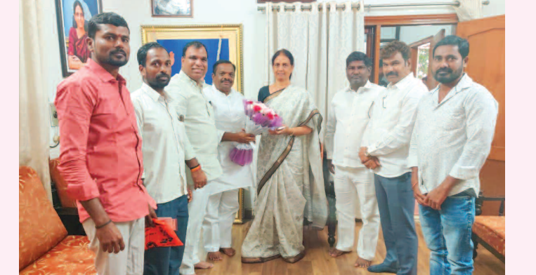
మాజీ మంత్రి పి నబితా ఇంద్రారెడ్డి కి నూతన సంవత్సర శుభాకాంక్షలు తెలుపుతున్న రాజేంద్రనగర్ జి.ఎస్.ఎస్ నాయకులు