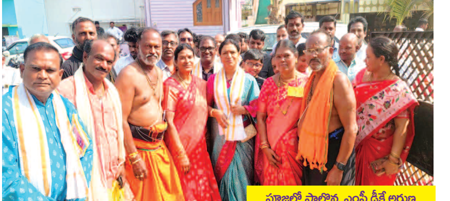
పూజల్లో పాల్గొన్న ఎంపీ డిశే అరుణ

గద్వాల ప్రతినిధి, జనవరి 1 (ప్రభాత ఉదయం) అయ్యప్ప స్వామి దీక్షలతో గద్వాల పట్టణంలో ఆధ్యాత్మిక శోభ నెలకొంది. దీనిలో భాగంగా అయ్యప్ప స్వామి భక్తులు స్వామి ఉత్సవముర్చిని, సప్త నదుల నుండి కూడిన 1008 సహస్ర కలశాలతో పట్టణంలో బుధవారం ఊరేగించారు. ఆనంతరం గద్వాల పట్టణంలోని పాత హొసింగ్ బోర్డు కాలనీలోని అయ్యప్ప దేవాలయం వద్ద అయ్యప్ప మహా పడిపూజ కార్యక్రమం నిర్వహించారు. ఉదయం ప్రభాతసేవ, గణపతిపూజ, అయ్యప్పస్వాములు