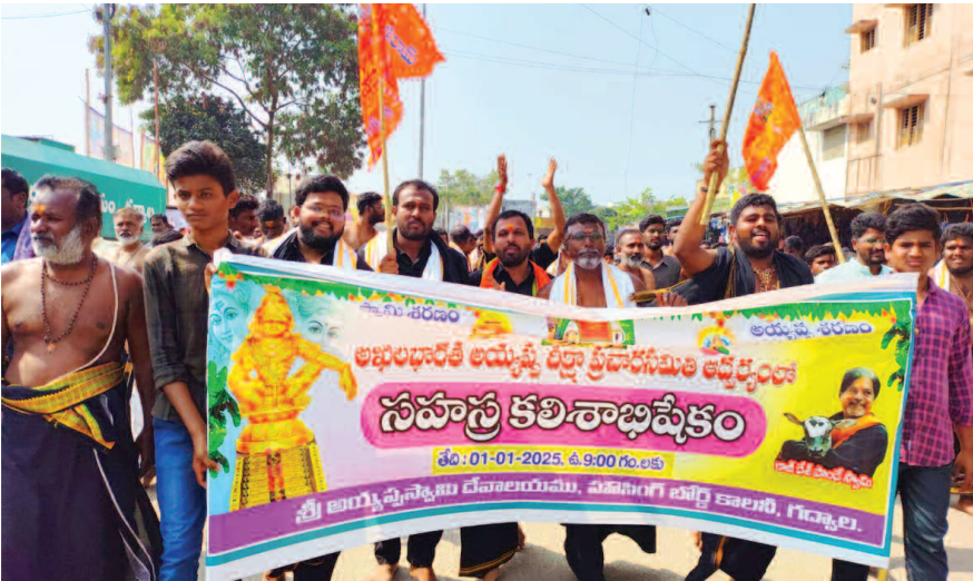
అయ్యప్ప స్వాములు సహస్ర కలిశాభిషేకం

భక్తిపాటలు, భజనలతో పరవశించిన అయ్యప్పస్వాములు