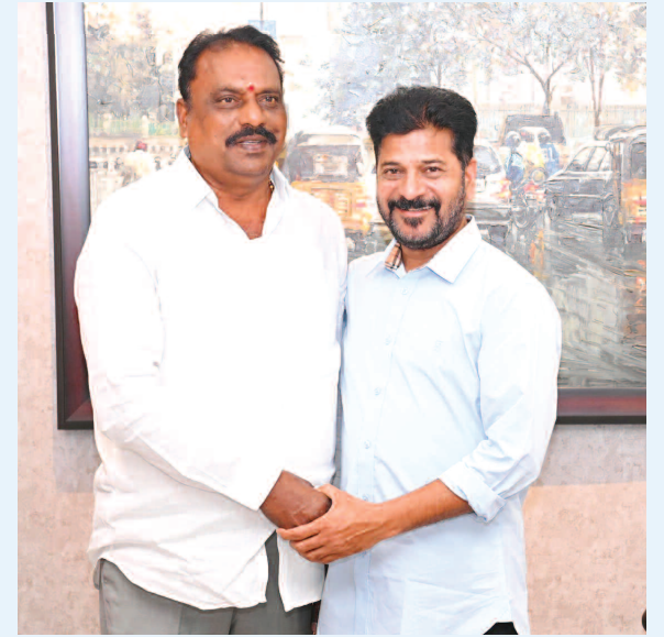
ముఖ్యమంత్రి రేవంత్ రెడ్డి ని కలసి నూతన సంవత్సర శుభాకాంక్షలు తెలుపుతున్న రాజేంద్రనగర్ ఎమ్మెల్యే టి ప్రకాష్ గౌడ్