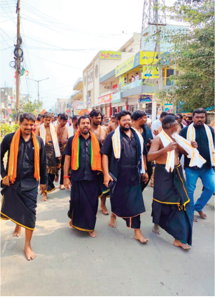
పాదయాత్రలో అయ్యప్ప స్వాములు

నిర్వహించారు. ఆనంతరం అయ్యప్పస్వాములు 1008 సహస్ర కలశాలతో గద్వాల పట్టణంలో శోభాయాత్ర నిర్వహించారు. యాత్ర పాత బస్టాండ్, కొత్త బస్టాండ్ మీదుగా పట్టణ పురవిధుల గుండా ఊరేగింపుగా అయ్యప్ప స్వామి ఆలయం వరకు చేరుకుంది. పట్టణంలో శోభాయాత్ర నిర్వహిస్తున్న ప్రాంతంలో ప్రముఖులు, పట్టణ ప్రజలు పాల్గొని పూజలు నిర్వహించారు. అయ్యప్ప కరుణతో పట్టణాన్ని అభివృద్ధి చేసుకుందామన్నారు. ఊరేగింపులో అయ్యప్పస్వాములు భక్తిపాటలు, భజనలు,