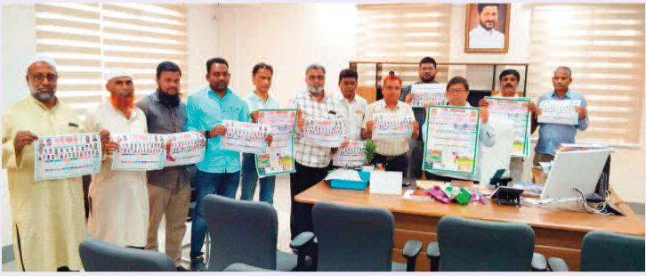
నూతన సంవత్సరం 25 క్యాలెండర్ ను విడుదల చేస్తున్న మైనారిటీ ఉద్యోగులు