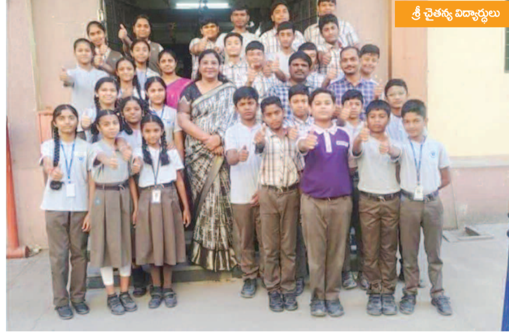
శ్రీ చైతన్య విద్యార్థులు