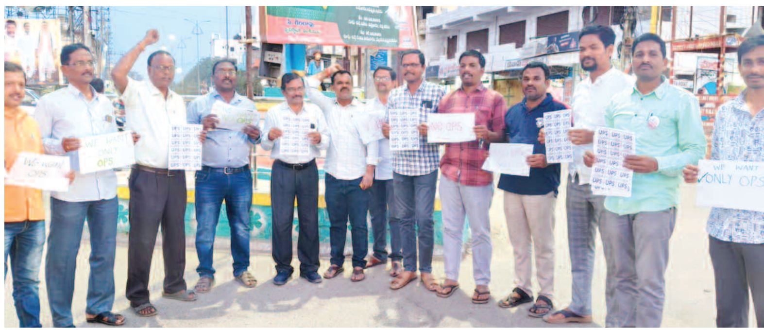
యూపిఎన్ ను వ్యతిరేకిస్తూ నిరసన వ్యక్తం చేస్తున్న జోగులాంబ గద్వాల జిల్లా టీఎన్ సిపిఎన్ ఇయ ప్రతినిధులు