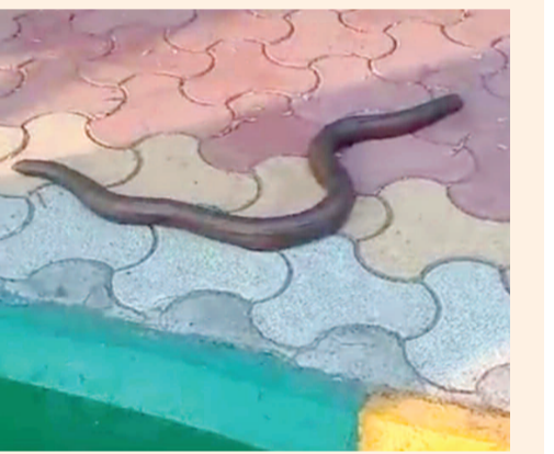
వ్యవసాయ విశ్వవిద్యాలయం బొటానికల్ గార్డెన్ వద్ద కనిపించిన రెండు తలల పాము. ఆ పాము ను పాద చారులు చెట్లలోకి కట్టడం పోషించారు.