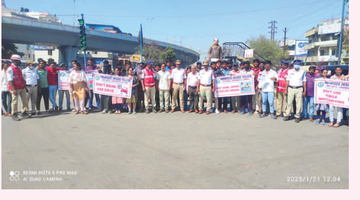
ఆరాంఘ్ చొరస్థాల్లో ట్రాఫిక్ నిబంధనలపై అవగాహన కల్పిస్తున్న ట్రాఫిక్ పోలీసులు, విద్యార్థులు