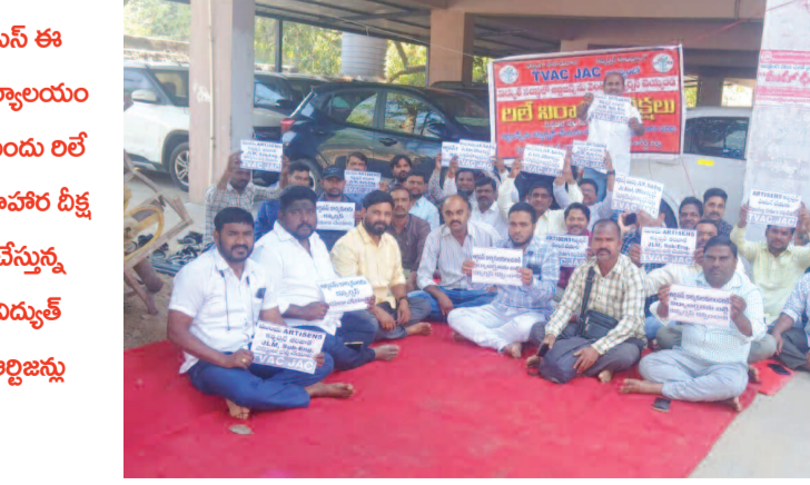
ఎన్ ఈ కార్యాలయం ముందు రిలే నిరాహార దీక్ష చేస్తున్న విద్యుత్ అల్లిజన్లు

హైదరాబాద్, జనవరి 20 (ప్రభాత ఉదయం): నగరంలో మదకద్రవ్యాలు విక్రయిస్తున్న సాఫ్టేర్ ఇంజనీర్ ను పోలీసులు అరెస్టు చేశారు. అతడి వద్ద నుంచి రూ.21 లక్షలు విలువైన 120 గ్రాముల ఎండిఎం క్రిస్టల్స్ ను స్వాధీనం చేసుకున్నారు. నిందితుడు ఆదనపు ఆదాయం కోసమే ఈ డ్రగ్స్ దండం చేస్తున్నట్లు వెల్లడించారు. జమ్మాకర్నీకు చెందిన సాఫ్టేర్ ఇంజనీర్.. హైదరాబాద్ లోని ఓ సంస్థలో పనిచేస్తున్నాడు. ఆదనపు ఆదాయం కోసం డ్రగ్స్ విక్రయిస్తున్నాడు. మండల సమాచారం అందుకున్న సంగారెడ్డి జిల్లా టాన్స్ పోలీస్, సానికెట్ ఎక్స్ కేబిలీసులు.. పుణె నుంచి హైదరాబాద్ కు వాహనంలో తీసుకొస్తున్న ఎండిఎం క్రిస్టల్ డ్రగ్స్ ను సీజ్ చేశారు. నిందితుడిని అదుపులోకి తీసుకున్నారు. నిందితుడు మొదట డ్రగ్స్ కు బానిసయ్యాడని.. పన్నును జీతమంతా వాటికే ఖర్చు అవుతుండడంతో డ్రగ్స్ విక్రయించడం మొదలు పెట్టినట్లు పోలీసులు తెలిపారు. క్రమంగా తోటి సాఫ్టేర్ ఉద్యోగులకు డ్రగ్స్ ను సరఫరా చేస్తున్నాడని వెల్లడించారు. కేసు నమోదు చేసి దర్యాప్తు చేస్తున్నట్లు చెప్పారు.