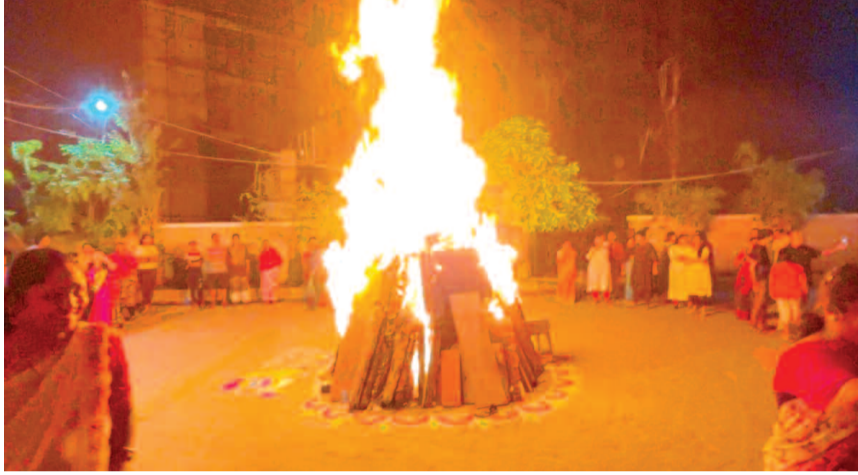
హైదర్ గూడ జనప్రియ హిటోపియ పద్ద భాగీ మంటలు