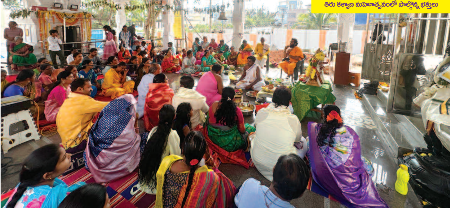
తిరు కళ్యాణ మహోత్సవంలో పాల్గొన్న భక్తులు