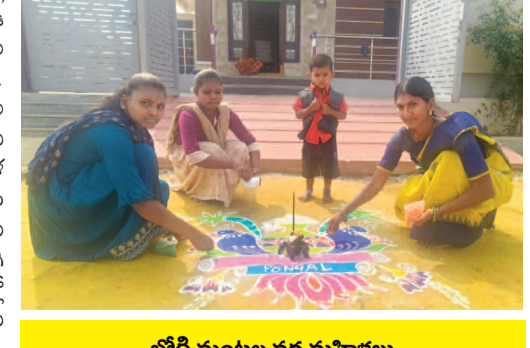
భోగి మంటల వద్ద మహిళలు

గద్వాల జిల్లా ప్రతినిధి, జనవరి 13(ప్రభాత ఉదయం)జిల్లా వ్యాప్తంగా భోగి సందంబరాలు సోమవారం ఘనంగా నిర్వహించారు. ఉదయమే పల్లె, పట్టణాల్లో ఇళ్ళ వాకిళ్ళ ముంగిట రంగురంగుల ముత్యాల ముగ్గులతో ముంగిళ్ళను అందంగా అలంకరించారు. ఆయా ప్రాంతాల్లో వారివారి ఇళ్ల ఎదుట మహిళలు ముత్యాల ముగ్గులు వేయడంలో పోటీ పడ్డారు. ముత్యాల ముగ్గులను వేసి అందులో రంగులు నింపడంలో మహిళల సృజనాత్మక కళ నైపుణ్యాన్ని ప్రదర్శించారు. చిన్నారులకు భోగి పండ్లతో స్నానం చేయించారు. చిన్నారులు, యువకులు గాలి పటాలను ఎగురవేశారు. గద్వాల పట్టణంలో... గద్వాల పట్టణంలోని భోగి పండగను ప్రజలు ఘనంగా జరుపుకున్నారు. పట్టణంలోని కాలనీల్లో మహిళలు ఉదయమే ఇండ్ల ముందు ముగ్గులు వేసి గొబ్బెమ్మలు పెట్టారు. దీంతో కాలనీల్లో రంగుల మయంగా మారాయి.