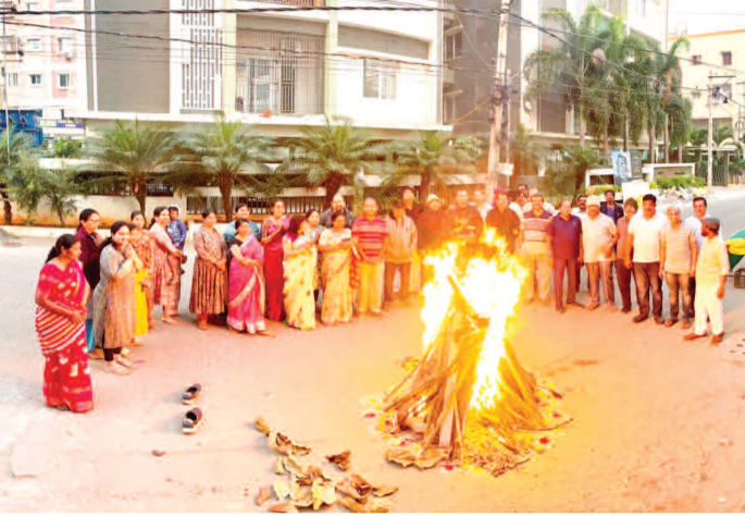
హైదర్ గూడ లక్ష్మీ రామ్ హరన్ అపార్ట్ మెంట్ ఆవరణలో సోమవారం ఉదయం భాగీ మంటలు వేసిన అపార్ట్ మెంట్ వాసులు