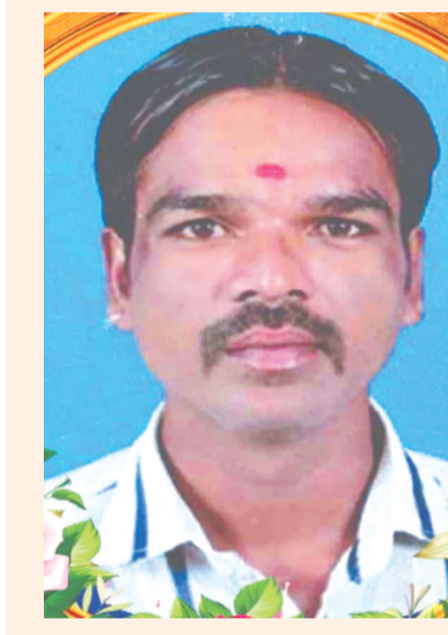
హాత్తుకు గుర్తిన లాటూని సాయి కుమార్ తొలిసారి మైక్రోసాఫ్ట్ లోనూ తొలిసారి హాత్తు చేసిన మేట్రి

మొదటి పేజీ తరువాయి... నడపాలని, జాగ్రత్తగా ఉండాలని సూచించారు. ఇదే సమయంలో సింధ్ లో టోడ్, సోనోవార్-కాల్ లో టోడ్, భద్రాచలం-చంబా రోడ్లో పాటు జిల్లా కాజీర్, హూస్ నుంచి షోపియాన్ (కశ్మీర్) వరకు కలిపే మొత్తం రోడ్లు ఇంకా మంచుతోనే ఉన్నాయి. వీటిని ఇంకా తెరువలేదు. వాతావరణం మెరుగుపడిన తరువాత శ్రీనగర్ అంతర్జాతీయ విమానాశ్రయం విమాన కార్యలాపాలు పునఃప్రారంభించ బయ్యాయి. పర్యాటకులు, ప్రయాణికులు ట్రాఫిక్ విభాగం నుంచి ప్రకారం ప్రయాణించాలని సూచించారు. అలాగే నేటి నుంచి రైలు సర్వీసులను పునరుద్ధరించారు. అయితే సోమవారం విస్తాడోమ్ సేవలు రద్దు చేయబడ్డాయి. ఈ క్రమంలో లోయలోని చాలా జిల్లాల్లో పడి ఉష్ణోగ్రత సాధారణం కంటే 2 నుంచి 6 డిగ్రీలు తక్కువగా ఉంది. అదివారం రాజాని శ్రీనగర్లో గరిష్ట ఉష్ణోగ్రత 4.7 డిగ్రీలు నుంచి 4.2 డిగ్రీలు సెల్సియస్ వరకే ఉంది. హవాల్లో 5.8 డిగ్రీలు, గుల్మాల్లో 5.3 డిగ్రీలు నుంచి మైనం 2.0 డిగ్రీలు సెల్సియస్ వరకే ఉంది. జమ్మూల్లో గరిష్ట ఉష్ణోగ్రత 20.5 కాగా, కనిష్ట ఉష్ణోగ్రత 6.1 డిగ్రీలు సెల్సియస్ గా నమోదైంది. బియాల్లో 6.1 డిగ్రీలు సెల్సియస్, బాట్లో 7.9, క్రాలో 18.0, భద్రాచలం 10.0 డిగ్రీలు సెల్సియస్ గా నమోదైంది. లోవా లో గరిష్ట ఉష్ణోగ్రత 0.6 డిగ్రీలు సెల్సియస్ గా నమోదైంది. గుల్మాల్లో పగలు, రాత్రి ఉష్ణోగ్రతలు సున్నా కంటే తక్కువగా ఉండటం విశేషం.