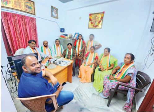
మాట్లాడుతున్న కాంగ్రెస్ నాయకులు

అక్రమ నిర్మాణాలు చేపడుతూ అభివృద్ధిని ప్రశ్నిస్తావా? హోసింగ్ బోర్డ్ స్థలాన్ని కట్టా చేసి అక్రమ నిర్మాణాలు చేపట్టి కోట్లాది రూపాయలు సంపాదించింది మీరు కాదా...? లోపాయికారీగా బిఆర్ఎస్ కు ఓట్లు వెయ్యించిన చరిత్ర కార్పొరేటర్ మందాడి... బహిరంగ చర్చకు సిద్ధమా?