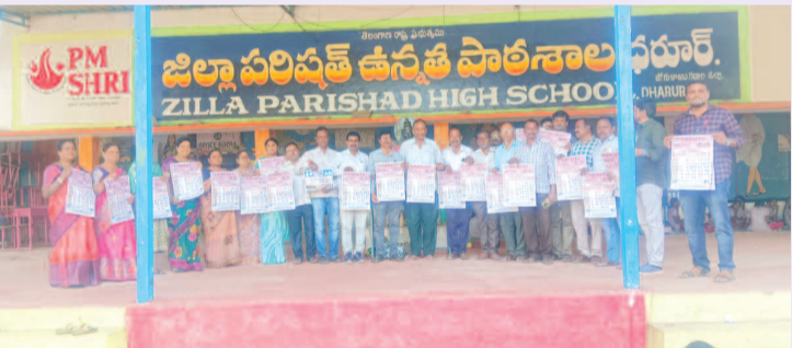
నూతన సంవత్సర క్యాలెండర్లు ఆవిష్కరిస్తున్న ఉపాధ్యాయ సంఘం ప్రతినిధులు