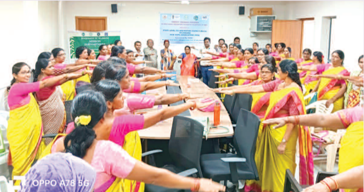
ప్రతిజ్ఞ చేస్తున్న మహిళలు