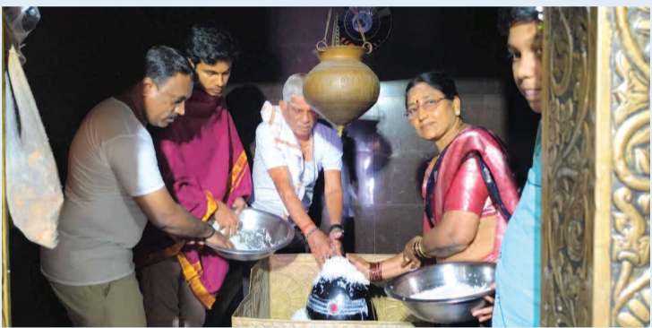
శ్రీ తోటి లింగేశ్వర స్వామికి అభిషేకం చేస్తున్న భక్తులు