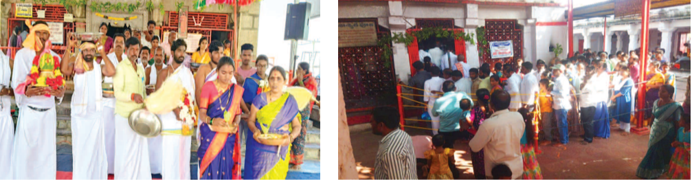
పాగుంటా శ్రీలక్ష్మీవేంకటేశ్వర స్వామి ఆలయంలో స్వామి వారి కళ్యాణోత్సవం... పెద్ద చింతరేణుల శ్రీరాజయ్య స్వామి ఆలయం వద్ద బాలులు తీరిన భక్తులు

గద్వాల జిల్లా ప్రతినిధి, డిసెంబర్ 30(ప్రభాత ఉదయం)జిల్లా వ్యాప్తంగా ఉన్న పలు ఆలయాలలో అమావాస్య ప్రత్యేక పూజలు సోమవారం ఘనంగా జరిగాయి. కేటిడొడ్డి మండల పరిధిలోని వెంకటాపురం గ్రామంలో వెలసిన పాగుంటా శ్రీలక్ష్మీ వేంకటేశ్వర స్వామి ఆలయం, ధర్మార మండలం చింతరేణుల శ్రీరాజయ్య స్వామి ఆలయం, మల్లకల్ శ్రీనియంభూ లక్ష్మీవేంకటేశ్వర స్వామి ఆలయం, బీనుపల్లి శ్రీరాజయ్య స్వామి ఆలయం తదితర ప్రసిద్ధ ఆలయాలలో సోమవారం అమావాస్య సందర్భంగా స్వామి వారికి అభిషేకాలు, అర్చనలు నిర్వహించి భక్తులు భక్తిచ్రదలతో ప్రత్యేక పూజలు చేశారు. భక్తులు అఖండ భజనలు నిర్వహించి తీర్చిదిద్దారు స్వీకరించారు. కేటిడొడ్డి, ధర్మార మండల కేంద్రంతో పాటు, వరసర గ్రామాల ప్రజలు, కర్ణాటక ప్రజలు పాగుంట లక్ష్మీ వేంకటేశ్వర స్వామి, చింతరేణుల అంజనేయస్వామి స్వామి వార్లను దర్శించుకున్నారు. అనంతరం ఆలయాలలో మహా అన్నదానం కార్యక్రమం నిర్వహించారు.