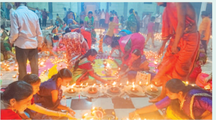
అమావాస్య సందర్భంగా దీపాలు వెలిగిస్తున్న మహిళా భక్తులు

గద్వాల జిల్లా ప్రతినిధి, డిసెంబర్ 1 (ప్రభాత ఉదయం) కార్తీకమాసం అమావాస్య సందర్భంగా ఆదివారం గద్వాలలోని శివాలయాల్లో ప్రత్యేక పూజలు ఘనంగా జరిగాయి. భీంసగర్ లోని శ్రీభీమలింగేశ్వర ఆలయం, నల్లకుంటలోని శివాలయం, సుంకులమ్మ మెట్టలోని శివాలయం, తదితర అన్ని శివాలయాల్లో పూజలు జరిగాయి. వేకువజామనే అర్చనలు ఆలయాల్లోని మూలవిరాట్లకు పలు అభిషేకాలు, అలంకరణలు చేసి ప్రత్యేక పూజలు జరిపారు. భక్తులు పెద్దఎత్తున తరలివచ్చి స్వామి దర్శనం చేసుకున్నారు. అనంతరం ఆలయాలు ప్రాంగణాల్లో కార్తీక దీపాలు వెలిగించి మొక్కులు తీర్చుకున్నారు. కార్తీక దీప కాంతులతో ఆలయాలు ప్రత్యేక శోభను సంతరించుకున్నాయి.