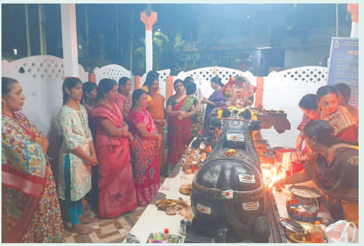
శివాలయంలో నందిశ్యురుడికి పూజలు చేస్తున్న మహిళ భక్తులు

వదిలేసిన రైతు బంధు బకాయిలు 7,625 కోట్ల రూపాయల కూడా ప్రజా ప్రభుత్వం అధికారం చేపట్టిన వెంటనే చెల్లించింది. గతంలోపని చేస్తే ఉరి వేసుకోవలసిందే. ధాన్యం కొనుగోలు కేంద్రాలే ఉండవని చెప్పిన పరిస్థితుల నుంచి వరి వేసుకోండి. కొంటామని చెప్పి భరోసా ఇవ్వడంతో పాటు సన్నాలు వేసుకుంటే బోనస్ ఇస్తామని ప్రోత్సహించాం. వర్షాకాలంలో సన్నాలకు బోనస్ ఇచ్చాం. బోనస్ ఒక్కసారి ఇచ్చి వదిలేయడం కాదు. వచ్చే సీజన్లో కూడా బోనస్ ఇస్తాం. తెలంగాణలో వాడకం ఎక్కువగా ఉన్న అలాగే దిగుబడి అధికంగా ఉండే తెలంగాణ సోనా, టీపీటీ, హెచ్ఎంటీ వేయాలి. తెలంగాణ ప్రజలు అత్యధికంగా ఈ బియ్యం ఎక్కువగా తింటారు. రేషన్ దుకాణాల ద్వారా పంపిణీ చేయడమే కాకుండా ఎస్సీ, ఎస్టీ, బీసీ, మైసూరీ వంటి ప్రభుత్వ వసతి గృహాల్లో సన్న బియ్యంతో అన్నం పెట్టమన్నాం. ఆ విషయాన్ని కూడా దృష్టిలో పెట్టుకుని రైతాంగం అధిక వినియోగం ఉన్న సన్న రకాలను వేయాలి. ఈ ప్రభుత్వం రైతుల కోసమే ఉన్నది. వ్యవసాయం దండగ కాదు. పండుగ అన్న భరోసా రైతుల్లో కల్పించాలని ముఖ్యమంత్రి అన్నారు.