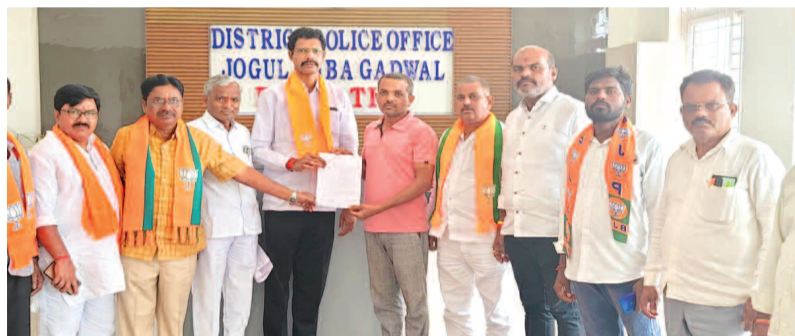
కానిస్టేబుల్స్ అసోసియేషన్ కి ఫిర్యాదు చేస్తున్న జజిమి నాయకులు