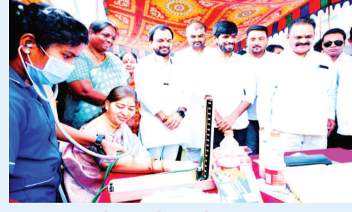
వైద్య శిబిరంలో వైద్య పరిష్కలు చేయించుకుంటున్న మాజీ