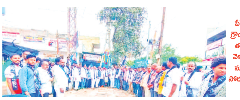
పేరెడ్ గ్రౌండ్ కు తరలి వెళ్లిన నాయకులు