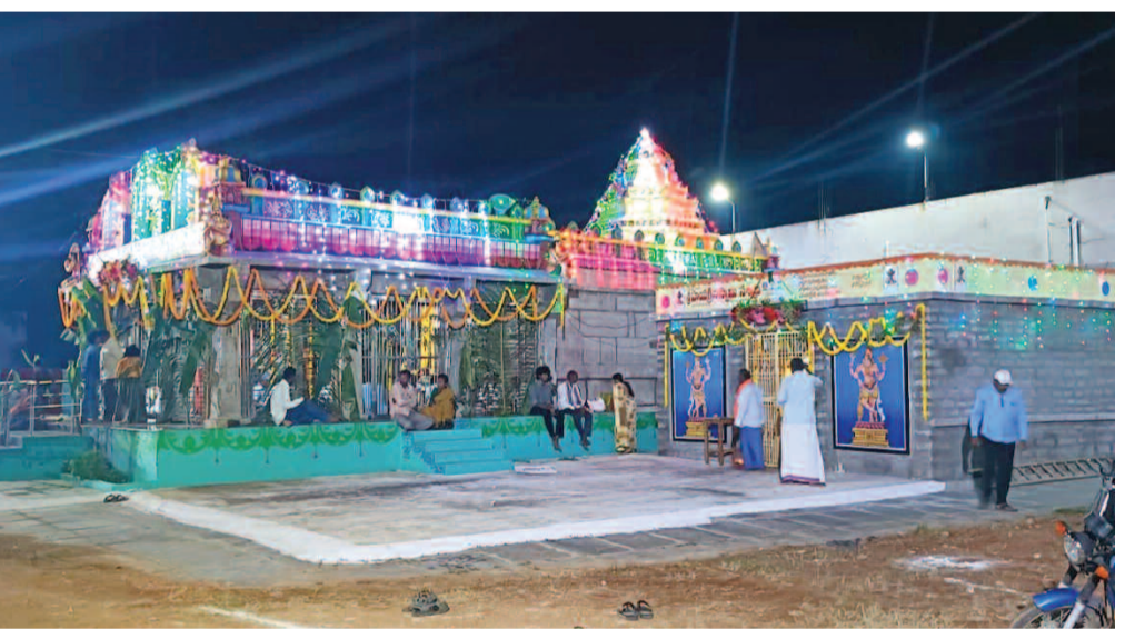
రంగురంగుల దీపాలతో ముసాబైన్ శ్రీ వేణుగోపాల స్వామి ఆలయం