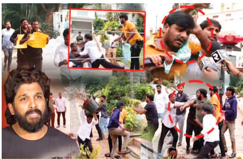
దాడిని ఖండించిన సీఎం రేవంత్ రెడ్డి