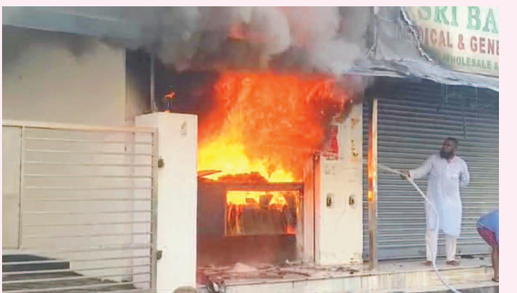
డ్రై క్లీనింగ్ దుకాణం లో మంటలు