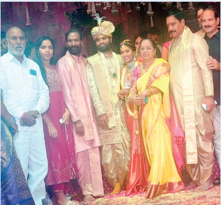
నూతన వధూవరులను ఆశీర్వదిస్తున్న సీనియర్ నాయకులు ఏం భీమ్ రెడ్డి నూతన వధూవరులు

చర్యలు తీసుకుంటాం: మన్యూ అధికారి కేటిడొడ్డి మండలంలో చెట్లను నరకకుండా తమ సిబ్బంది చర్యవేత్తిస్తున్నారు. కేటిడొడ్డి మండలంలో చెట్ల నరికిన విషయం నా దృష్టికి రాలేదు. చెట్లను నరికినవారిపై అటవీశాఖ చట్టం ప్రకారం కఠిన చర్యలు తీసుకుంటాం.