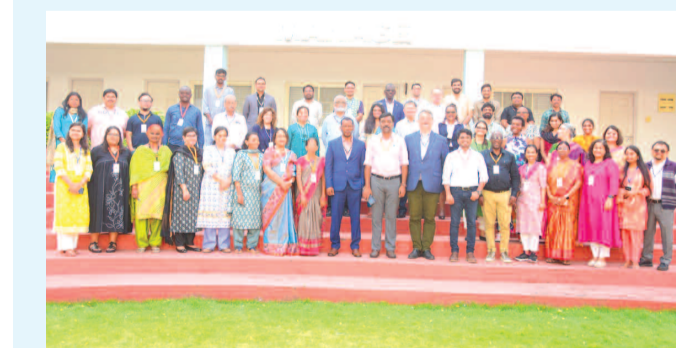
మేనేజిల్ జరిగిన వర్క్ షాప్లో పాల్గొన్న వివిధ దేశాల ప్రతినిధులు