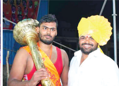
గత సంవత్సరం కేసరి టైటిల్ సాధించిన మల్లయోధుడితో నిర్వాహకులు గౌరవ రాజు పహిల్యాన్