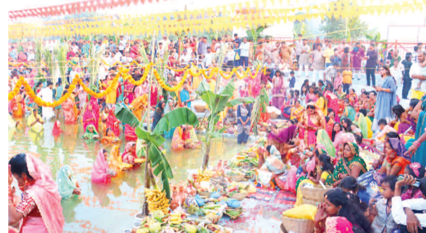
గంగా దేవీకి ఫలహారం అందజేస్తున్న మహిళలు