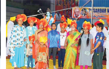
మహిళా మల్ల యోధులు