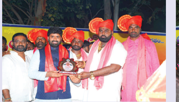
సికింద్రాబాద్ ఎంపీ ఎం. అనిల్ కుమార్ యాదవ్ కు జ్ఞాపికను అందచేస్తున్న మజ్జగి నరేష్ యాదవ్