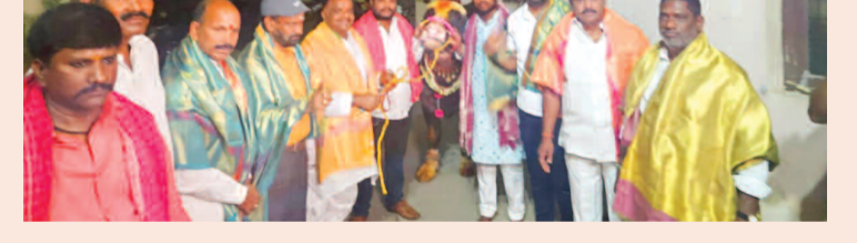
సదర్ వేడుకలలో పాల్గొన్న హైదర్ గూడ నాయకులు