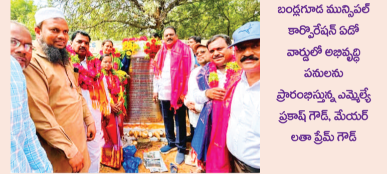
బండగూడ మున్సిపల్ కార్పొరేషన్ ఏడో వార్షికోత్సవం వనూలను ప్రారంభిస్తున్న ఎమ్మెల్యే ప్రకాష్ గౌడ్, మేయర్ లతా ప్రీమ్ గౌడ్