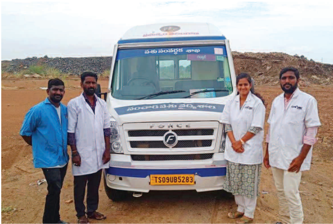
పశు వైద్య సంవార సిబ్బంది నిండుకోవడం క్షేత్రస్థాయిలో మూగజీవుల అందలేదని పరిస్థితి వచ్చినందున అనేక సంవత్సరాల నుండి నిధులు విడుదల కాకపోవడంతో బకాయి వద్ద జీతాలు ఇవ్వలేని పరిస్థితి నెలకొంది. 1962 వాహనాల మందుకుడా

రోజురోజుకు కుటుంబ పోషణ భారం అరకొర జీతమే సమయానికి రావు మూగ జీవాల సేవల్లో ప్రథమం జీతాల్లో అధమం 1962 సిబ్బందిని పట్టించుకోని ప్రభుత్వం