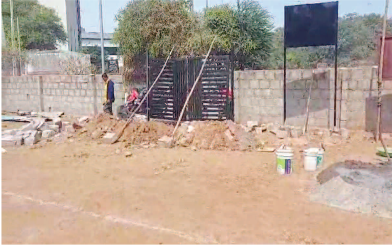
రింగాన్ శ్రీ అనంత పద్మనాభ స్వామీ దేవాలయ స్థలంలో నిర్మించిన ప్రవారీ గోడ ను కూల్చి బోర్డు ఏర్పాటు చేస్తున్న ప్రైవేటు వ్యక్తులు