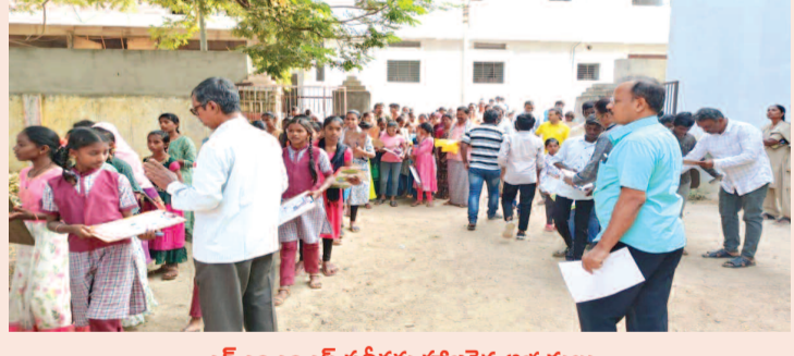
ఎన్ఎంఎంఎస్ పరీక్షకు హాజరైన అభ్యర్థులు ప్రశాంతంగా ఎన్ఎంఎంఎస్ పరీక్ష