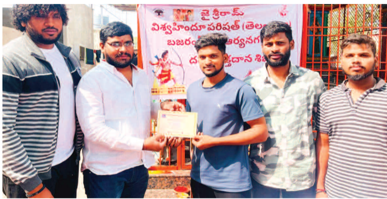
రక్త దానం చేసిన వారికి సర్టిఫికేట్ లు బాహుకరిస్తున్న బజ్జీ రంగ్ దత్ నేతలు ఛాన్సెల్ రెడ్డినగర్లో రక్తదానం