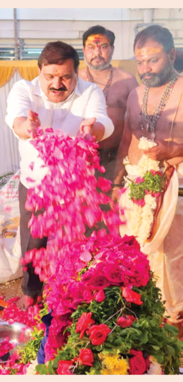
పూజలలో పాల్గొన్న మాజీ మంత్రి డాక్టర్ పట్నం మహేందర్ రెడ్డి