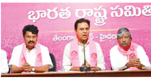
తెలంగాణ మాకు కావాలని నిరసించారు. కేసీఆర్ సమర్థుల తెలంగాణ తెచ్చుకో అని తెగువను ప్రదర్శించిన నాయకుడికి అందగా నిలబడ్డారు. అందర్నీ మెప్పించి ఒప్పించి, దేశ రాజకీయ వ్యవస్థను, రాష్ట్రంలో ఉండే రాజకీయ వ్యవస్థను కులముతాలకు అతీతంగా కలిపింది దీక్షా దివస్ అని కేటీఆర్ గుర్తు చేశారు.

కాంగ్రెస్ కబంధహస్తాల నుండి నాలుగు కోట్ల తెలంగాణ ప్రజలను కాపాడుకోవాలని మరో సంచలన దీక్ష చేపట్టాల్సిన తరుణం ఆసన్నమైంది అని బీఆర్ఎస్ పర్సనల్ ప్రెసిడెంట్ కేటీఆర్ పేర్కొన్నారు. తెలంగాణకు స్వీయ రాజకీయ అస్తిత్వమే శ్రీరామరక్ష అని ప్రాఫెసర్ జయశంకర్ చెప్పిన మాటలను కేటీఆర్ గుర్తు చేశారు. తెలంగాణ భవన్లో ఆయన నేడు మీడియాతో మాట్లాడుతూ, తెలంగాణ చరిత్రలో ఉద్భవనేత, మాజీ సీఎం కేసీఆర్ ది చెరగని ముద్ర అని అన్నారు. . 2009 నవంబర్ 29వ తేదీ.. కేసీఆర్ దీక్షతో తెలంగాణ ఉద్యమం మలపు తిరిగిందన్నారు. కేసీఆర్ దీక్ష తెలంగాణపై చెరగని ముద్ర వేసినందు గుర్తు చేశారు. నవంబర్ 29వ తేదీన 33 జిల్లా కేంద్రాల్లో దీక్షా దివస్ కార్యక్రమాన్ని ఘనంగా నిర్వహించనున్నట్లు తెలిపారు.