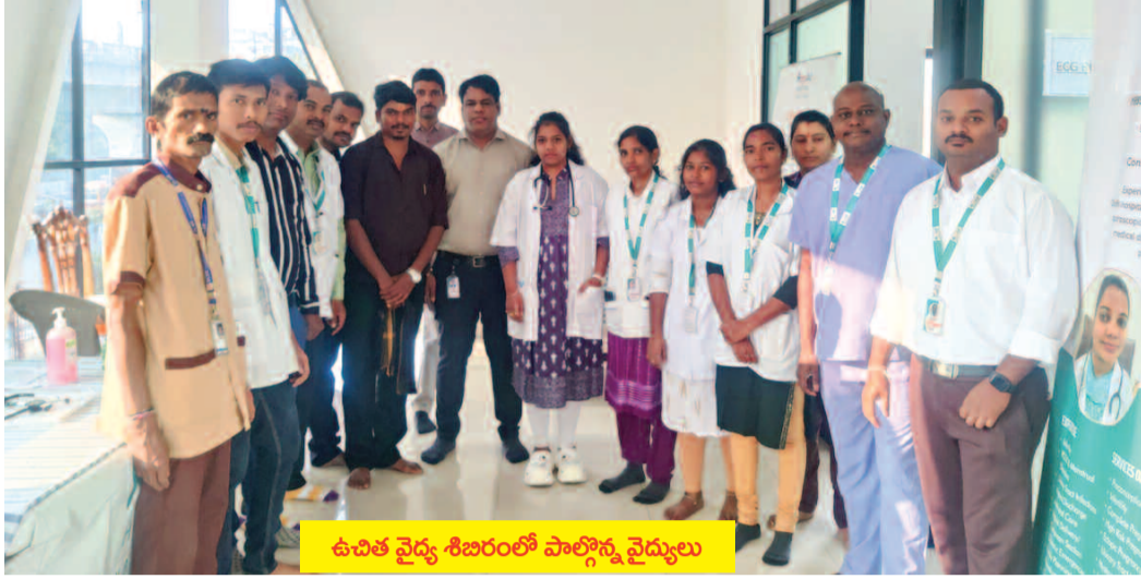
ఉచిత వైద్య శిబిరంలో పాల్గొన్న వైద్యులు