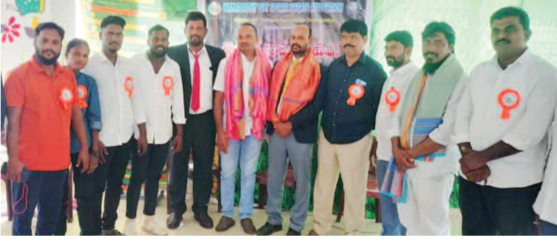
జిల్లా కలావీ నూతన కార్యవర్గం