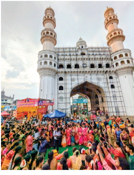
చార్మినార్ వద్ద బతుకమ్మ వేడుకలు నిర్వహిస్తున్న మహిళలు

చార్మినార్, అక్టోబర్ 4(ప్రభాత ఉదయం) పాతబిల్డి చార్మినార్ వద్ద బతుకమ్మ ఉత్సవాలను మహిళలు భక్తిశ్రద్ధలతో ఘనంగా నిర్వహించారు. శుక్రవారం మహిళలు సామాహికంగా బతుకమ్మను పూలతో పేర్చి అటపాటలతో సంతోషంగా నిర్వహించారు.