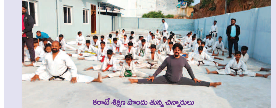
కరాటే శిక్షణ పొందు తున్న చిన్నారులు