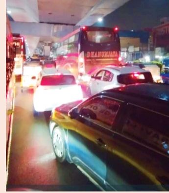
అత్తాపూర్లో స్తంభించిన ట్రాఫిక్

బుద్వేల్, అక్టోబరు 4(ప్రభాత ఉదయం) : శుక్రవారం సాయంత్రం బుద్వేల్ గంటల నుంచి రాత్రి 9 గంటల వరకు అత్తాపూర్ రోడ్లలో ట్రాఫిక్ జాం ఏర్పడింది. దీంతో వాహన దారులు, ప్రయాణికులు, విద్యార్థులు తీవ్ర ఇబ్బందులు పడ్డారు. రోడ్లపై వాహనాలు పాదయ అగిపోవడం, మంచినీటి పైపులైను లీకేజీ సీరితా రోడ్లమీదికి చేరడంతో ఈ ట్రాఫిక్ జామ్ ఏర్పడిందని స్థానికులు తెలిపారు. గంటల తరబడి ట్రాఫిక్ జామ్ కావడంతో కళాశాలల నుంచి ఇంటికి వచ్చే విద్యార్థులు, ఉద్యోగాల నుంచి ఇంటికి వచ్చే ప్రజలు నానా అవస్థలు పడ్డారు. ట్రాఫిక్ జామ్ ను క్రమబద్ధీకరించడానికి ట్రాఫిక్ పోలీసులు నానా ఇబ్బందులు పడ్డారు.