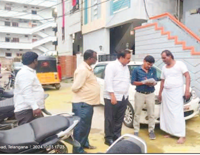
గుమ్మ కొండ కాలనీ లో ఫ్యామిలీ డిజిటల్ కార్డు వైబల్ సర్వీస్ చేస్తున్న అధికారులు