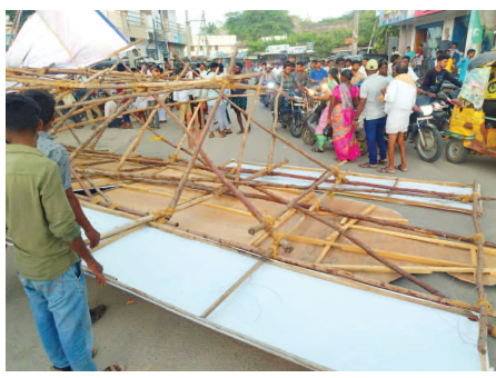
పాత బస్స్టాండ్ వైసీఆర్ ఛాక్ వద్ద నేలకొరిగిన కటౌట్

గద్వాల జిల్లా ప్రతినిధి, అక్టోబర్ 3(ప్రభాత ఉదయం)వర్షం, ఈదురు గాలులు కారణంగా గురువారం మద్దాపూం జిల్లా కేంద్రంలో వైస్ఆర్ ఛాక్ లో ఏర్పాటు చేసిన ఓ భారీ కటౌట్ ఒక్కసారిగా పెట్టిన విరిగి పడింది. భారీ కటౌట్ వక్రం నిలబడిన ఓ మహిళపై పడటంతో గాయలయ్యాయి. గాయపడిన మహిళను ఆసుపత్రికి తరలించారు. వైస్ ఆర్ ఛాక్ లో ఏర్పాటు చేసిన భారీ కటౌట్ నేలకొరగడంతో వాహనాల రాకపోకలకు అంతరాయం ఏర్పడింది. అంతే కాకుండా కటౌట్ కు కట్టిన సరివి కర్రలు పెద్ద శబ్దంతో పడడంతో రోడ్డుపై వెళ్లే ప్రజలు వరుగులు పెట్టారు. కటౌట్ నేల కాలడంతో గమనించిన వాహనదారులు జాగ్రత్తపడ్డారు. గద్వాల పట్టణ పరిధిలోని ధర్మారా మెట్టు, తదితర ప్రాంతాలలో ఏర్పాటు చేసిన కటౌట్ లు, పైకీలు ఈదురు గాలులకు నెలకొరిగి విరుక్కొని పడిపోయాయి. ఆ సమయంలో ఎవరు లేకపోవడంతో పెను ప్రమాదం తప్పింది. కొద్దిపాటి గాలి దుమారానికి కటౌట్ లు ఇలా కూలడం దానిని ఏర్పాటు చేసిన నిర్వాహల నిర్లక్ష్యానికి నిదర్శనం. ఇలాంటి కటౌట్లు, పైకీలు ఏర్పాటు చేసిన పాలకులు కార్యక్రమాల అనంతరం తొలగించకుండా అలాగే ఉంచేటంటే పట్టణ ప్రజలు విమర్శిస్తున్నారు. అంతేకాకుండా గద్వాల మున్సిపాలిటీ పరిధిలో అక్రమంగా వెలసిన పైకీలు, కటౌట్ లు తొలగించాలిగా పట్టణ ప్రజలు అధికారులకు విజ్ఞప్తి చేస్తున్నారు.