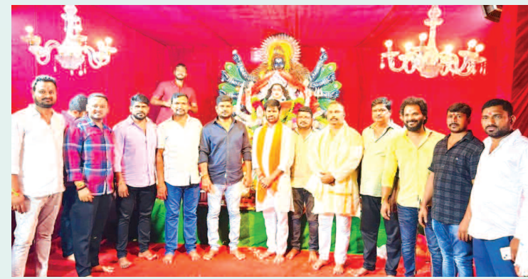
దేవి శరన్నవరాత్రి ఉత్సవాలలో పాల్గొన్న స్థానిక నాయకులు