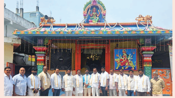
హైదర్ గూడ శ్రీ పోచమ్మ తల్లి ని దర్శించుకున్న భక్తులు