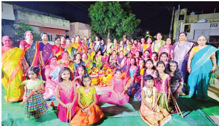
అంజనాద్రి నగర్ లో బతుకమ్మ ఆడుతున్న మహిళలు