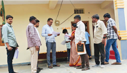
కేటిడొడ్డి మండలం మైలగడ్డ డిజిటల్ సర్వేను పరిశీలిస్తున్న పరిశీలనాధికారి