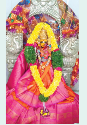
శ్రీ పార్వతి దేవి అలంకరణలో కొలువుదీరిన అమ్మ వారు

బుద్గేట్, అక్టోబరు3(ప్రభాత ఉదయం): రాజేంద్రనగర్ లోని శ్రీ వెంకటేశ్వర స్వామి దేవాలయం హరి హర క్షేత్రంలో గురువారం నుంచి శ్రీదేవి శరన్నవరాత్రి దసరా మహోత్సవాల అంగారం ప్రారంభం అయినట్లు ప్రకటించారు. ఈనెల 12వ తేదీ వరకు ఈ ఉత్సవాలు నిర్వహించడం జరుగుతుందని దేవాలయ కమిటీ ప్రతినిధులు తెలిపారు. గురువారం శ్రీ పార్వతి దేవి అమ్మవారి అలంకరణ లో భక్తులకు దర్శనమిచ్చారు. 4వ తేదీన శ్రీ బాల త్రిపుర సుందరి దేవిగా, 5వ తేదీ గాయత్రీ దేవిగా, ఆరవ తేదీ శ్రీ అన్నపూర్ణాదేవిగా, 7వ తేదీ శ్రీ లలిత త్రిపుర సుందరి దేవిగా, 8వ మంగళవారం శ్రీ మహాలక్ష్మి దేవిగా, ఈ నెల9వ తేదీ బుధవారం శ్రీ సరస్వతి దేవిగా, 10వ తేదీ శ్రీ దుర్గా దేవిగా, 11వ శ్రీ మహిషాసుర మర్ధిని దేవిగా, 12వ తేదీన శ్రీ రాజరాజేశ్వరి దేవి అలంకరణలో అమ్మవారు దర్శనమిస్తారన్నారు. అదే రోజున విజయదశమి పంచమిగా నిర్వహించడం జరుగుతుందని దేవాలయ కమిటీ ప్రతినిధులు వివరించారు.