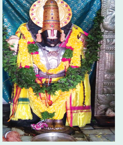
ప్రత్యేక అలంకరణలో శ్రీ వెంకటేశ్వర స్వామి

బుద్గేట్, అక్టోబరు3(ప్రభాత ఉదయం): కలియుగ పుత్రుడైన శ్రీ వెంకటేశ్వర స్వామి దేవాలయం ప్రార్థనా కేంద్రంగా రాజేంద్రనగర్ లోని శ్రీ వెంకటేశ్వర స్వామి దేవాలయంలో కొలువుదీరిన స్వామివారిని ఆందంగా ఆలంకరించి పూజలు చేశారు. తిరువతి తిరువతి దేవస్థానంలో శ్రీ వెంకటేశ్వర స్వామి బ్రహ్మోత్సవాలు జరిగి రోజులలో రాజేంద్రనగర్ లో కూడా స్వామివారిని ప్రతి రోజు ప్రత్యేకంగా ఆలంకరించి పూజలు చేయడం ఆనవాయితీగా వస్తుంది. విజయదశమి వేడుకల వరకు ఇలా స్వామివారిని ప్రత్యేకంగా ఆలంకరించి పూజలు చేయడం జరుగుతుందని దేవాలయ కమిటీ ప్రతినిధులు తెలిపారు.