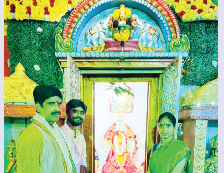
శ్రీ పార్వతీ దేవి అమ్మవారిని దర్శించుకుంటున్న భక్తులు..