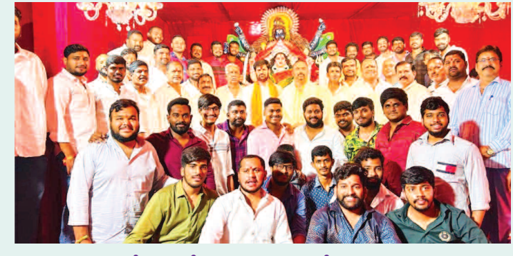
అలయంలో కొలువచేసిన అమ్మవారి పూజల్లో పాల్గొన్న యువకులు

రాజేంద్రనగర్, అక్టోబర్ 3(ప్రభాత ఉదయం) రాజేంద్రనగర్ సర్కిల్ పరిధిలోని ఉప్పరపల్లిలో శ్రీ దేవి శరన్నవరాత్రి ఉత్సవాలు భక్తిశ్రద్ధలతో ఘనంగా ప్రారంభమయ్యాయి. గురువారం రెడ్డి బస్టి కమ్యూనిటీ హాల్లో శ్రీ వీరాంజనేయ భక్త సమాజం ఆధ్వర్యంలో నెలకొల్పిన దుర్గామాత కు ప్రత్యేక పూజలు నిర్వహిస్తున్నారు. దేవీ నవరాత్రి ఉత్సవాలు ప్రారంభం సందర్భంగా ఆ అమ్మవారి దీవెనలు అందరిపై ఉండాలని మనస్తూర్తిగా నిర్వాహకులు కోరుకున్నారు.