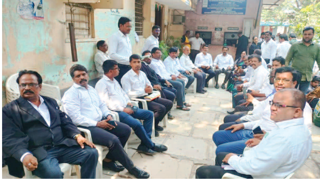
ఉప్పర పల్లి కోర్టులో విధులను బహిష్కరించి నిరసన వ్యక్తం చేస్తున్న న్యాయవాదులు

రాజేంద్రనగర్ ఉప్పరపల్లి కోర్టు ఆవరణలో దాడికి నిరసనగా న్యాయవాదులు ఆందోళన..