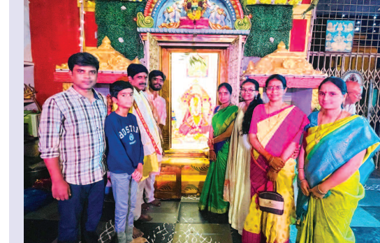
రాజేంద్రనగర్ శ్రీ వెంకటేశ్వర స్వామి దేవాలయం వారి వార క్షేత్రం లో శ్రీ పార్వతీ దేవి అలంకరణలో కొలువచేసిన అమ్మవారిని దర్శించుకుంటున్న భక్తులు