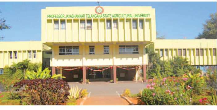
ప్రాఫెసర్ జయశంకర్ తెలంగాణ వ్యవసాయ విశ్వవిద్యాలయం పరిపాలన భవనం