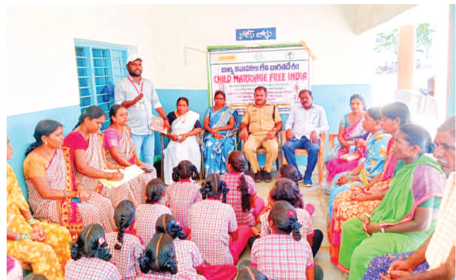
బాల్య వివాహాల నిర్మూలనకు అనగాహన కల్పిస్తున్న అధికారులు