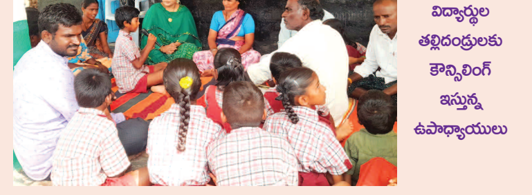
విద్యార్థులకు తల్లిదండ్రులకు కౌన్సిలింగ్ ఇస్తున్న ఉపాధ్యాయులు