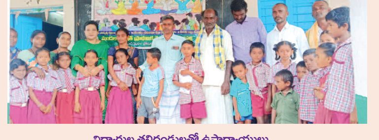
విద్యార్థుల తల్లిదండ్రులతో ఉపాధ్యాయులు