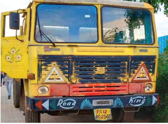
ప్రమాదానికి కారణమైన టీఎస్12 యుడి 2561 నెంబర్ బస్