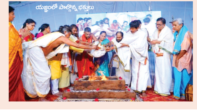
యజ్ఞంలో పాల్గొన్న భక్తులు