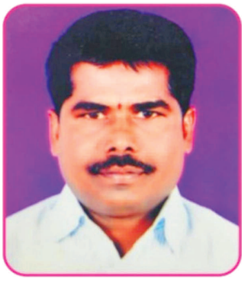
పాగుల రాములు గౌడ్