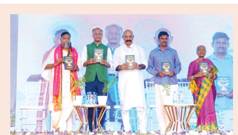
ఇంద్ర యజ్ఞం పుస్తకాన్ని ఆవిష్కరిస్తున్న ప్రముఖులు