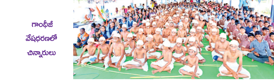
గాంధీజీ వేషధారణలో చిన్నారులు