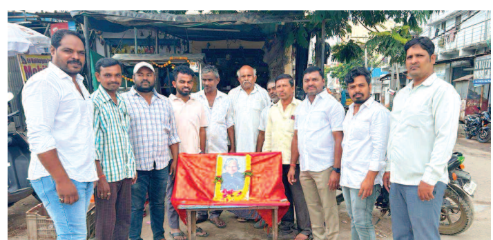
మాజీ రాష్ట్రపతి ఏపీజే అబ్దుల్ కలాం చిత్ర పటానికి పూలమాలలు వేసి నివాళులు అర్పిస్తున్న నవ యువ యువజన సంఘం సభ్యులు