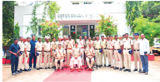
పోలీస్ స్టేషన్ అధికారులు, సిబ్బంది సిబ్బందితో ఎస్ పి శ్రీనివాసరావు

గవార్ల జిల్లా ప్రతినిధి, అక్టోబర్ 15(ప్రభాత ఉదయం) వార్షిక తనిఖీలలో భాగంగా మంగళవారం జిల్లా ఎస్పీ టి.శ్రీనివాస రావు గవార్ల రూరల్ పోలీస్ స్టేషన్ ను సందర్శించి స్టేషన్ రికార్డ్స్ ను, పోలీస్ స్టేషన్ పరిసరప్రాంతాలను పరిశీలించారు. అనంతరం పోలీస్ అధికారులు సిబ్బందితో ముఖాముఖి నిర్వహించారు. పోలీస్ అధికారులకు, సిబ్బందికి ఏవైనా సమస్యలు ఉన్నాయో అని తెలుసుకొని నర్టీస్ కు సంబంధించిన సమస్యలు ఉంటే తమ దృష్టికి తీసుకురావాలని సూచించారు. విధినిర్వహణలో పోలీస్ అధికారులు సిబ్బంది పోటీపడి విధులు నిర్వహించాలని, అంకిత భావంతో విధులు నిర్వహించే వారికి రివార్డులు అవార్డులు ప్రతినెలా ఇవ్వడం జరుగుతుందని, ఎవరికీ కేటాయించిన విధులు వారు బాధ్యతా నిర్వహించాలని, సిబ్బంది వివరాలు, వారు నిర్వహిస్తున్న విధుల గురించి అడిగి తెలుసుకున్నారు. వర్తికల్ వారిగా అధికారులు సిబ్బంది విధులు నిర్వహించాలని ప్రజల సమస్యలు తీర్చడానికి ఎల్లవేళలా అందుబాటులో ఉండి సేవలు అందించాలని సూచించారు. ప్రజలతో మరియు పోలీస్ స్టేషన్ కు వచ్చే భాధితలతో మధ్యధానాధికంగా మాట్లాడాలని ఫిర్యాదుదారులందరికీ ఒకే రకమైన సేవలు అందించాలని సూచించారు. ప్రతి ఒక్కరూ జిల్లా పరిధిలోనే ఉండి విధులు నిర్వహించాలని, సమయం దొరికినప్పుడు ఫ్యామిలీతో సంతోషంగా ఉండాలని సిబ్బందికి సూచించారు. ప్రతిరోజూ పోలీసు అధికారులు సిబ్బంది సమయం దొరికినప్పుడు వ్యాయామం, యోగా, ధ్యానం, వాకింగ్ చేస్తూ ఆరోగ్యాన్ని కాపాడుకోవాలని సూచించారు. ప్రతి ఒక్కరూ నీట్ ట్యూప్ అవుట్ కలిగి ఉండి, మంచి క్రమశిక్షణ సమయాలను పాటించాలని