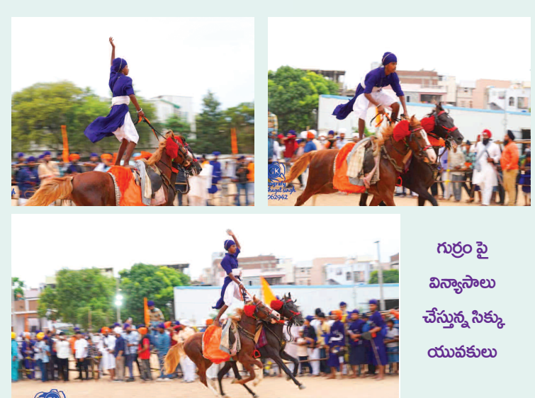
గుర్రం పై విన్యాసాలు చేస్తున్న సిక్కు యువకులు