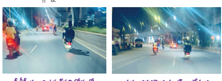
వీడివీ నుంచి ఉప్పల్ వరకు రోడ్డులో ద్వీచక్రవాహనంపై ప్రమాదకరమైన స్టంట్ లు చేస్తున్న యువకుడు