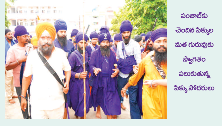
పంజాబ్ కు చెందిన సిక్కుల మత గురువుకు సాగ్తం పలుకుతున్న సిక్కు సోదరులు

రెజిస్ట్రేషన్ గర్కు వచ్చిన సిక్కుల మత గురువు బుద్వేల్, అక్టోబరు15(ప్రభాత ఉదయం): పంజాబ్ చెందిన సిక్కుల 16వ అధిపతి జర్నల్ జాతీయ బాబా జోగ్ సింగ్ జీ మంగళవారం రాజేంద్రనగర్ సర్కిల్ సిక్ వాపుస్ లోని గురుద్వారా సాహెబ్ బరంబారా ను సందర్శించారు. అంతేకాకుండా షాహీన్ బాబా అర్చన సింగ్ జీ సహా ఆస్థానీలను సందర్శించారు. గురునానక్ దేవ్ జీ చోక్ గ్రౌండ్ లోని గుర్రపు స్వారి షోలను సందర్శించారు. హైదరాబాద్ లోని సిక్కు చౌసీ మహారాజా రంజిత్ సింగ్ నగర్ లోని అన్ని సంగణీలకు స్వారీ చేసి ఆశీర్వాదాలు అందించారు.