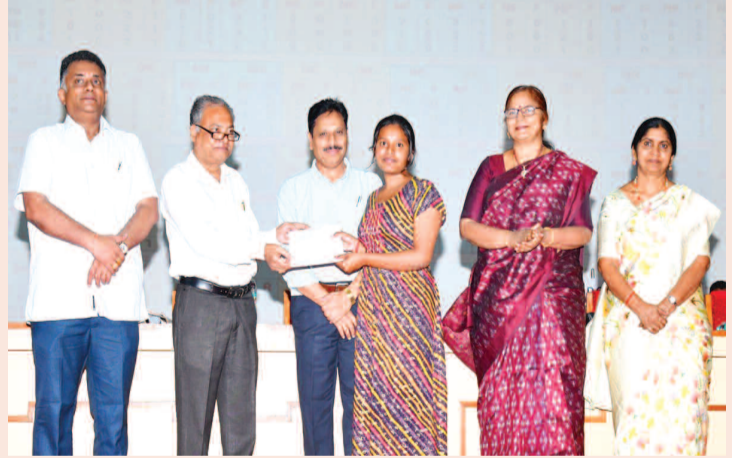
మొదటి పశు వైద్య కోర్స్ ప్రవేశకరణ పత్రం అందుకుంటున్న విద్యార్థిని స్వాగ్రీ వ్యవసాయ విశ్వవిద్యాలయం ప్రారంభమైన యూజీ వ్యవసాయ, వెటర్నరీ, ఉద్యాన కాంపుల కౌన్సిలింగ్ రాజేంద్రనగర్ వెటర్నరీ కళాశాలలో తొలి అడ్మిషన్ పాఠశాల ఎం స్వాగ్రీ