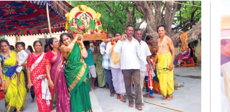
స్వామివారిని పట్లకలో ఊరేగిస్తున్న భక్తులు