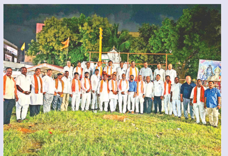
దసరా వేడుకలలో హైదర్ గూడ నాయకులు