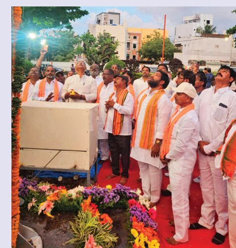
దసరా వేడుకల సందర్భంగా భగవద్దజం ఆవిష్కరణ..

బుద్వేల్, అక్టోబరు 13 (ప్రభాత ఉదయం) : అత్తాపూర్ డివిజన్ హైదర్ గూడ లో దసరా ఉత్సవాల కన్నుల పండుగగా జరిగాయి. చారిత్రాత్మక చిన్న లాంతగిరి శివాలయం కేంద్రంగా ప్రణవభక్త సమాజం ఆధ్వర్యంలో జరిగిన వేడుకలలో అత్తాపూర్ చుట్టుపక్కల ప్రాంతాలకు చెందిన అన్ని వర్గాల ప్రజలు సంతోషంగా పాల్గొని సంబరాలు జరుపుకున్నారు. ఈ సందర్భంగా 85 అడుగుల భగవద్దజం ఆవిష్కరణ జరిగింది.