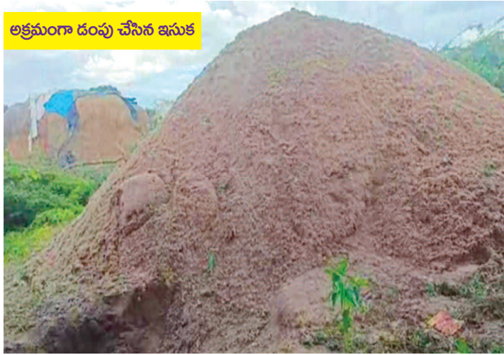
అక్రమంగా దంపు చేసిన ఇసుక