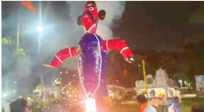
చిన్న లాంతగిరి శివాలయం ఆవరణలో రావణ దహనం