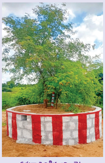
పప్పుగా పెరిగిన జమ్మి చెట్టు