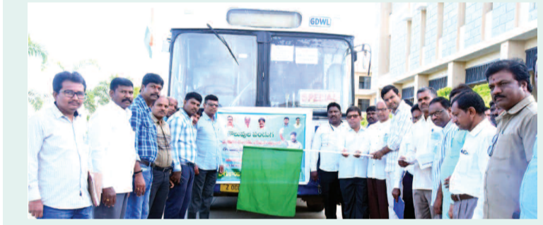
ఉద్యోగ నియామక పత్రాలు అందుకోవడానికి వెళ్తున్న అభ్యర్థుల బస్సును జండా ఊపి ప్రారంభిస్తున్న కలెక్టర్ సంతోష్