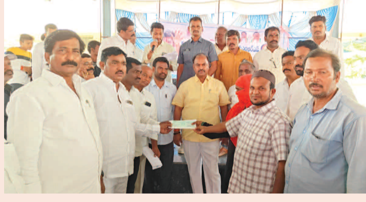
లబ్ధిదారులకు చెక్కులను అందజేస్తున్న ఎమ్మెల్యే కృష్ణ మోహన్ రెడ్డి