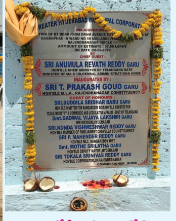
సుమారు కోటి రూపాయల తో కొత్తగా ఏర్పడిన డ్రీమ్ ఇండియా వద్ద వేయడానికి శిలాఫలకం ఏర్పాటు చేసిన అధికారులు

కొత్తగా వెలసిన కాలనీలో కోటి రూపాయలతో రోడ్లు : ఎన్నో సంవత్సరాలుగా ఉన్న గగన్ పహాడ్ బస్ స్టేషన్ రోడ్డు వేయమని అడుగుతుంటే పట్టించుకోని అధికారులు, రాజేంద్రనగర్ ఎమ్మెల్యే ప్రకాష్ గౌడ్ కొత్తగా వెలసిన డ్రీమ్ ఇండియా, డ్రీమ్ ఎవెన్యూ ప్రాంతాలలో మాత్రం కోటి రూపాయలతో రోడ్డు వేయడానికి శ్రీకారం చుడుతున్నారు. ఇదెక్కడి న్యాయమంటూ బీజేపి రాజేంద్రనగర్ నియోజకవర్గ కన్వీనర్ సూర్య వివేక్ రెడ్డి ప్రశ్నించారు. ఇప్పటికైనా ప్రజా ప్రతినిధులు, అధికారులు గగన్ పహాడ్ పాత బస్ స్టేషన్ రోడ్డు వేయాలని కోరుతున్నారు.