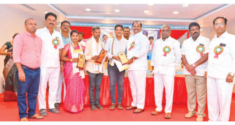
వృత్తిలో మంచి సేవలు అందిస్తున్న ఉపాధ్యాయులను సన్మానిస్తున్న ఎమ్మెల్యే కృష్ణ మోహన్ రెడ్డి...