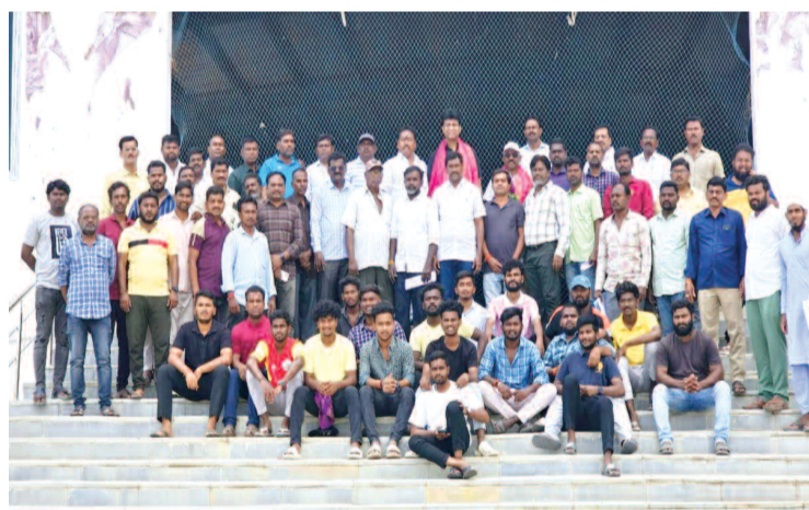
పుట్ బాల్ అసోసియేషన్ సూతన కార్యక్రమం