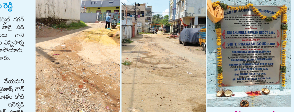
అధ్యానంగా మారిన గగన్ పహాడ్ రోడ్డు

బుద్వేల్, సెప్టెంబర్ 29 (ప్రభాత ఉదయం): రాజేంద్రనగర్ సర్కిల్ గగన్ పహాడ్ బస్ స్టేషన్ రోడ్డు అధ్యానంగా తయారయ్యాయి. రోడ్డు పాడై పది సంవత్సరాలు కావచ్చున అధికారులు కానీ ప్రజాప్రతినిధులు గాని పట్టించుకోవడం లేదు. తమ బస్ స్టేషన్ రోడ్డు వేయాలని అధికారులను ఎన్నిసార్లు కలసి వేడుకున్నా... పట్టించుకోవడంలేదని బిజినెసులు వాపోయారు. అన్నిసార్లు ప్రతి ఒక్కరు కడుతున్నారని రోడ్డు వేయాలని విజ్ఞప్తి చేశారు.