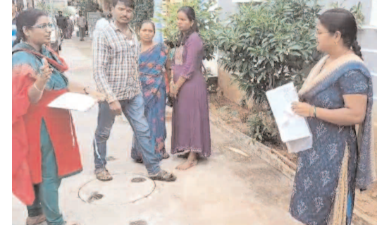
ఆసుపత్రులు, పనిచేస్తున్న ప్రాంతాల ఇక్కడ ఉంటే ఎక్కడో ఇచ్చే డబుల్ బెడ్ రూమ్ మాకెందుకు అంటూ నిలదీశారు.