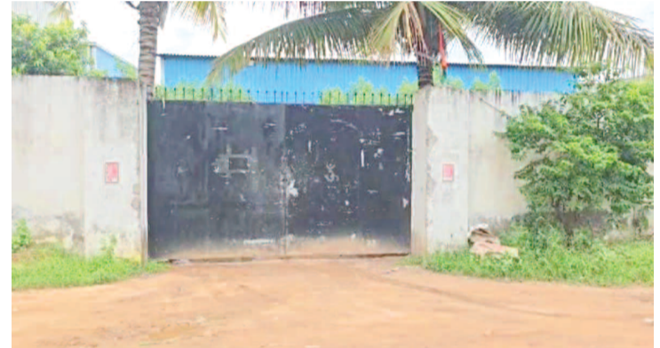
అనుమతులు లేకుండా వెళ్ల తయారు చేయడానికి ప్రయత్నిస్తున్న డి. ప్రయోజనుల పోలీసులు నిడులు