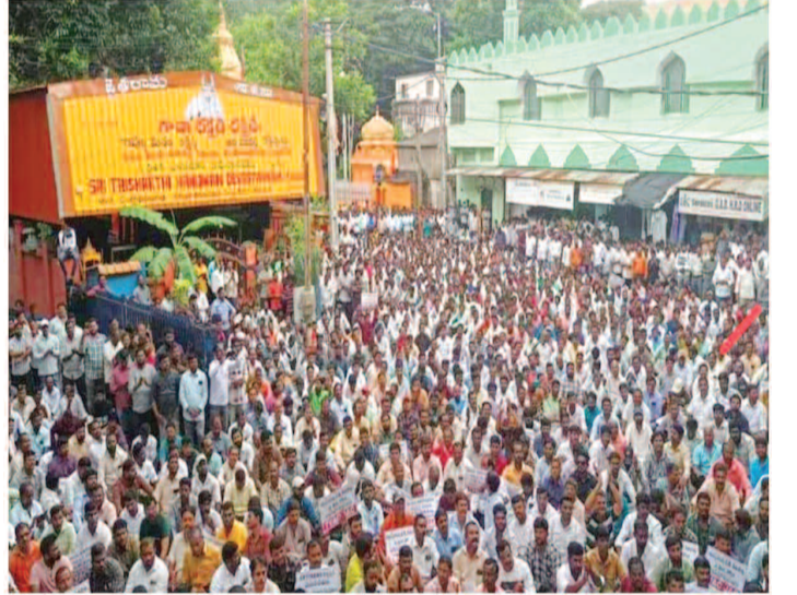
విద్యుత్ మింట్ కాంపౌండ్ ముందు బైలాయింబి ఆందోళన చేస్తున్న ఆర్టికల్స్

హైదరాబాద్, సెప్టెంబర్ 26 (ప్రభాత ఉదయం): దీర్ఘ కాలంగా అపరిష్కృతంగా ఉండిపోయిన విద్యుత్ శాఖలో పనిచేసే ఆర్టికల్స్ రెగ్యులరైజేషన్ ప్రక్రియను ప్రభుత్వం వెంటనే కంప్లీట్ చేయాలని డిమాండ్ చేస్తూ రక్షణ దిస్కం హెడ్ క్వార్టర్ల ముందు భారీ స్థాయిలో ఆ కార్మికులు జేసిన ఆందోళన నిర్వహించింది. ఆర్టికల్స్ కన్వెన్షన్ ప్రక్రియను ముగించాలని, అర్హతైన వారిని క్రమబద్ధీకరించాలని, ఆ తర్వాతనే మిగిలిన పోస్టులను భర్తీ చేయాలని డిమాండ్ చేశారు. పలు జిల్లాల నుంచి వేలాది మంది పాల్గొన్న ఈ ధర్నాతో మింట్ కాంపౌండ్ ప్రాంతం దిగ్బంధమైంది. నినాదాలతో సచివాలయ పరిసర ప్రాంతమంతా మార్కెటింగ్, జూనియర్ లైన్స్, జూనియర్ అసిస్టెంట్, సబ్స్టేషన్ పోస్టుల్ని భర్తీ చేయడానికి ముందే ఆర్టికల్స్ సర్వీసును రెగ్యులరైజ్ చేయాలని కార్మికులు డిమాండ్ చేశారు. కార్మికుల విద్యార్హతలకు అనుగుణంగా పదోన్నతులు కల్పించాలని డిమాండ్ చేశారు. రాష్ట్ర ప్రభుత్వం కూడా వెంటనే స్పందించి రెగ్యులరైజేషన్, పదోన్నతుల కోసం ప్రక్రియను ప్రారంభించాలని జేసిన ప్రతినిధులు కోరారు. ప్రభుత్వం సానుకూలంగా స్పందించనివ్వకపోతే ఉద్యమాన్ని ఉద్యతం చేస్తామని రక్షణ దిస్కం యాజమాన్యాన్ని హెచ్చరించారు.