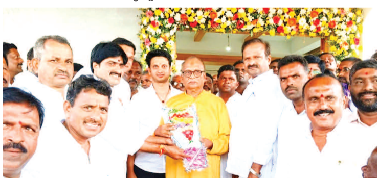
మాజీ ఎమ్మెల్యే డాక్టర్ రావుల రవీంద్రనాథ్ రెడ్డికి పుష్పగుచ్ఛం అందజేస్తున్న అలంపూర్ ఎమ్మెల్యే విజయుడు మాజీ ఎమ్మెల్యే డాక్టర్ రావులకు జన్మదిన శుభాకాంక్షలు తెలిపిన అలంపూర్ ఎమ్మెల్యే విజయుడు