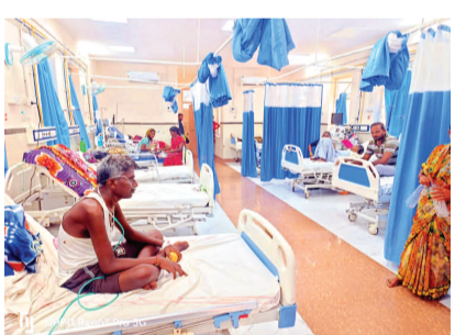
గద్వాల జిల్లా ఆస్పత్రిలో ఏసీ పనిచేయకపోవడంతో ఇబ్బందులు పడుతున్న రోగులు

గద్వాల జిల్లా ప్రతినిధి, సెప్టెంబర్ 20(ప్రభాత ఉదయం) జిల్లా కేంద్రంలోని ప్రభుత్వ ఏరియా ఆసుపత్రిలో ఐ.సి.యూ విభాగంలో సరైన మౌలిక వసతులు లేక రోగులు ఆరకార వసతుల మధ్యనే తిక్కి పొందుతున్నారు. రైతులకు ఎన్నికల కేరీ యూనిట్ లో తీవ్రమైన అనారోగ్యం లేదా గాయాలతో బాధపడుతున్న రోగులకు క్రిటికల్ కేరీ వసయం లైఫ్ సపోర్టును అందించే ప్రత్యేక ఆసుపత్రి ఏర్పాటు, ఆ యూనిట్ లో అనుభవం ఉన్న వైద్యులు, నర్సులు, రెసిడెంట్ థెరపిస్టులు నిరంతరం పర్యవేక్షణను అందించారు. కానీ ఆ యూనిట్ లో సరైన వసతులు లేకపోవడంతో రోగులు తీవ్ర ఇబ్బందులు ఎదుర్కొంటున్నారు. సరైన ఏసీ సౌకర్యం లేకపోవడంతో ప్రత్యామ్నాయంగా ఆరకార ఫ్యాన్లు ఏర్పాటు చేయడంతో ఉక్చోతకు రోగులు తీవ్ర ఇబ్బందులు ఎదుర్కొంటున్నారు ఈ విషయమై ఆస్పత్రి సూపరింటెండెంట్ వివోద్ వివరణ కోరగా ఐసీయూలో ఏసీలు రిపేర్ లో ఉన్న మాట వాస్తవమేనని, తాత్కాలికంగా ఫ్యాన్లను ఏర్పాటు చేశామని త్వరలోనే ఏసీలు రిపేర్ చేయించి అందుబాటులో ఉంచనున్నట్లు ఆయన తెలిపారు.