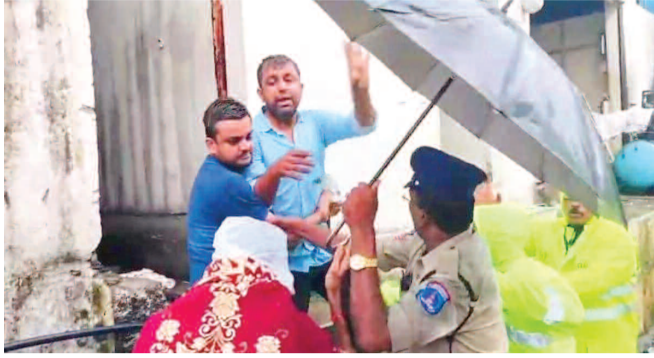
కూల్చివేతలను ఆపకపోతే అత్యనాధ్యమం చేసుకుంటామంటున్న ఓ మహిళ

అప్ప చెరువు పై భాగంలో తాము పరిశ్రమల ఏర్పాటు కోసం పేర్లు వేసుకున్నామని వాదించిన బాధితులు వాపోయారు. తమ పేర్లు కూల్చివేత అత్యనాధ్యమం చేసుకుంటామని ఒకరు హాల్ చల్ చేశారు. ఓ మహిళ తమ పేర్లు కూల్చివేతపై