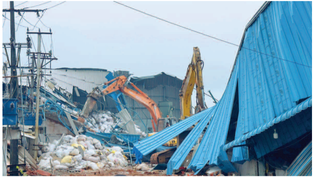
అప్ప చెరువులో ఆక్రమణలను తొలగిస్తున్న హైద్రా అధికారులు