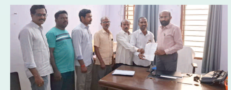
కమ్యూనిటీ హాల్ కోసం స్థలాన్ని కేటాయించాలని అందజేస్తున్న బక్సె వెల్డర్ అసోసియేషన్ నాయకులు, కాలనీ వాసులు.