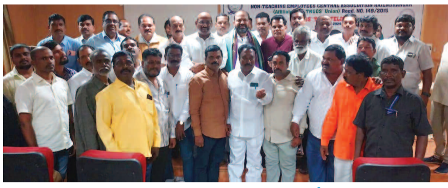
సన్మాన కార్యక్రమంలో పాల్గొన్న వెటర్నరీ యూనివర్సిటీ ఉద్యోగులు