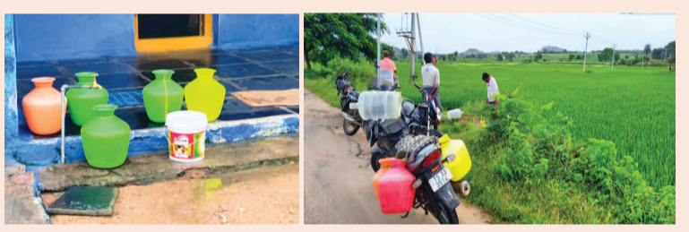
నల్గొండే నిక్ష రాక కోసం బిరెలు పెట్టిన ప్రజలు.. వ్యవసాయ బోరు మండి తాగునీటిని తీసుకెళ్లు ప్రజలు