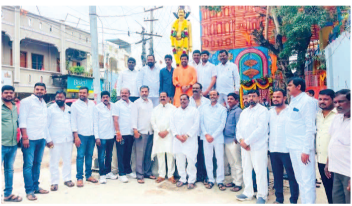
ఉప్పర్ పల్లి కోట్ల చౌరస్థాలో స్వర్ణయ యాదవ రెడ్డి విగ్రహానికి నివాళులర్పిస్తున్న నాయకులు