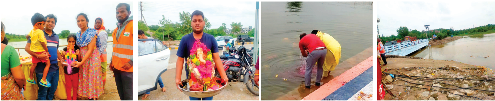
పత్తి కుంట లో వినాయకుని నిమజ్జనం చేయడానికి కుటుంబ సభ్యులతో భక్తులు... పత్తి కుంట లో నిమజ్జనం చేయడానికి వినాయకుని తీసుకువస్తున్న భక్తులు... పత్తి కుంట కొలనులో వినాయకుని నిమజ్జనం చేస్తున్న దంపతులు... పత్తి కుంట చెరువు... అన్ని ఏర్పాట్లు చేసాం : డిప్యూటీ కమిషనర్ కె. రవి కుమార్ రాజేంద్రనగర్ సర్కిల్ పరిధిలోని పత్తికుంట, పల్లె చెరువు, మీరాలం చెరువు వద్ద వినాయకుల నిమజ్జనాలకు అన్ని ఏర్పాట్లు చేపట్టడం జరిగింది. డిప్యూటీ కమిషనర్ కె రవికుమార్ తెలిపారు.