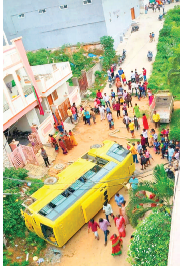
బోల్తా పడిన స్కూల్ బస్సు