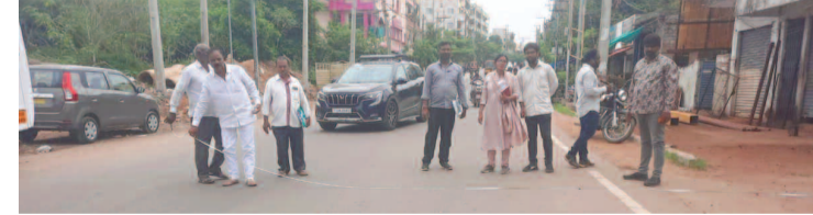
రోడ్డు పనులకు కొలతలు తీసుకుంటున్న అధికారులు