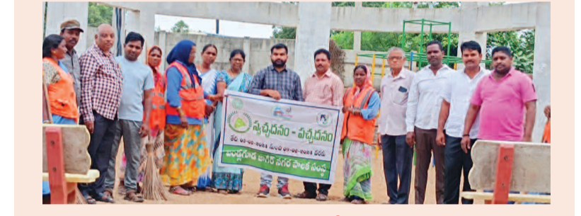
బండ్లగూడ భవాని కాలనీలో పచ్చదనం... స్వచ్ఛతనంపై అవగాహన కల్పించిన మున్సిపల్ అధికారులు