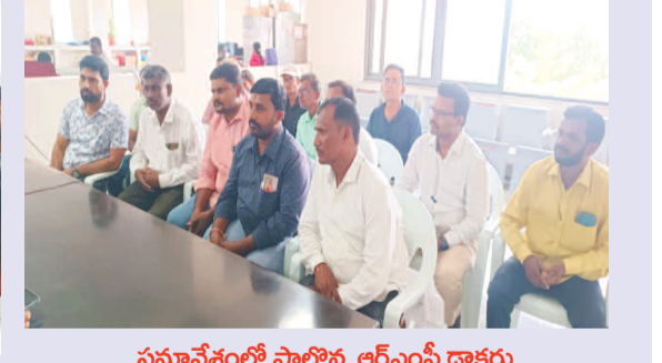
సమావేశంలో పాల్గొన్న ఆర్ఎంసీ డాక్టర్లు

చికిత్స అనే బోధ రాసుకోవాలని, ఎటువంటి (ప్రెస్ మార్చ్) (రెడ్ లీడా గ్రీన్) మార్పు ప్రథమ చికిత్స బోధపక్కల రాయకూడదన్నారు. రోగులకు ఎటువంటి ఐపీ ఘోషాన్ని మరియు యాంటీబయోటిక్స్, పెయిన్ కిల్లర్స్, స్ట్రోమాన్స్, మందులు ఇవ్వకూడదని, ప్రథమ చికిత్స కేంద్రంలో ఎటువంటి మంచాలు, ఐ వి స్టాండ్స్, ఐ వి ఘోషాన్ని, నెబులైజర్, ఎక్స్రే మెత్తంలో మందులు ఉంచుకోకూడదని సూచించారు. ప్రైవేట్