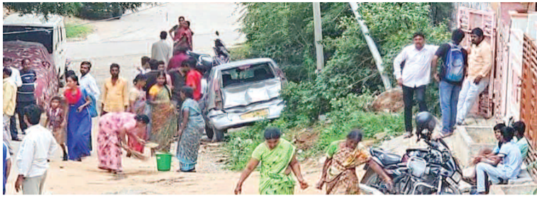
బస్సు వేగాన్ని ఆపిన కారు, విద్యుత్ స్తంభాలు