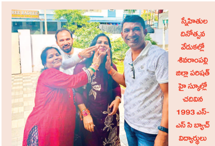
స్నేహితుల దినోత్సవ వేడుకల్లో శివరాంపల్లి జిల్లా పరిషత్ హై స్కూల్లో చదివిన 1993 ఎస్-ఎస్ సి బ్యాచ్ విద్యార్థులు

బుద్వేల్, ఆగస్టు 4(ప్రభాత ఉదయం): బుద్వేల్ బంగారు మైసమ్మ దేవాలయంలో ఆధిపత్యం ఓడి బియ్యం వండి అన్నదానం చేశారు. జూలై 28న జరిగిన భోజనం సందర్భంగా అమ్మవారికి నైవేద్యంగా సమర్పించిన ఓడి బియ్యంతో వంటచేసి భోజనం అన్నదానం చేశారు. ఈ కార్యక్రమంలో బుద్వేల్ కు చెందిన రజక సంఘం నాయకులు వారి కుటుంబ సభ్యులు పెద్ద ఎత్తున పాల్గొన్నారు. ప్రతి సంవత్సరం బుద్వేల్ లో భోజన ఉత్సవాలు ఘనంగా నిర్వహించడం జరుగుతుందని రజక సంఘం నాయకులు తెలిపారు.