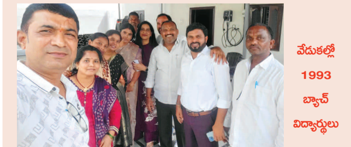
వేడుకల్లో 1993 బ్యాచ్ విద్యార్థులు