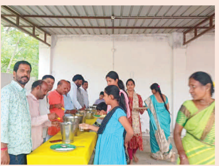
అన్నదాన కార్యక్రమంలో పాల్గొన్న బుద్వేల్ భక్తులు