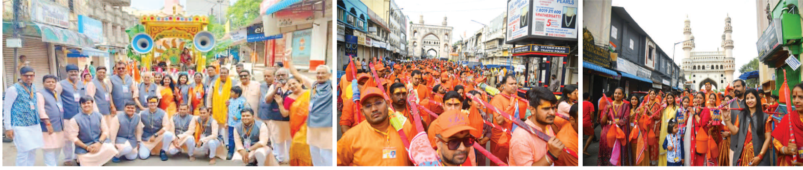
కావడి యాత్ర ఊరేగింపులో భక్తులు