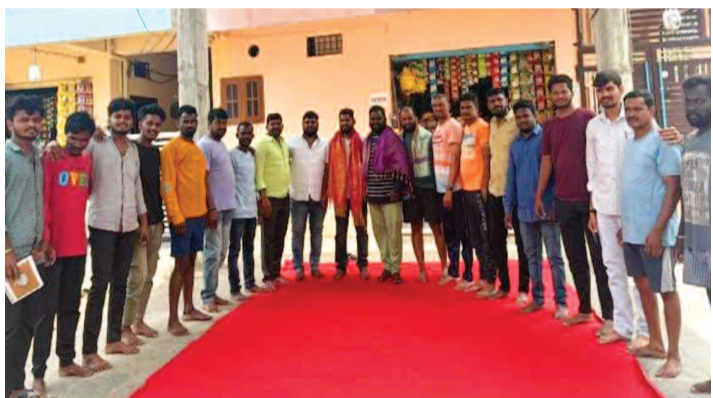
గణేష్ ఉత్సవ కమిటీ సభ్యులు