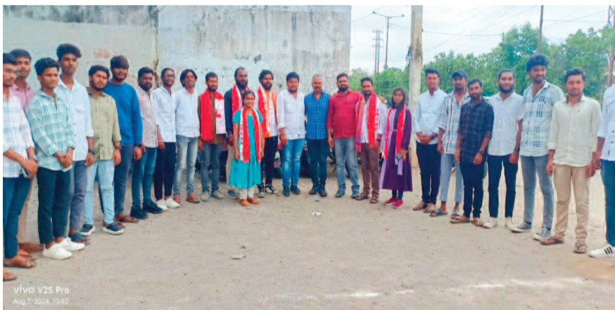
ఏ బి ఎస్ ఎఫ్ రంగారెడ్డి జిల్లా కమిటీ ప్రతినిధులు